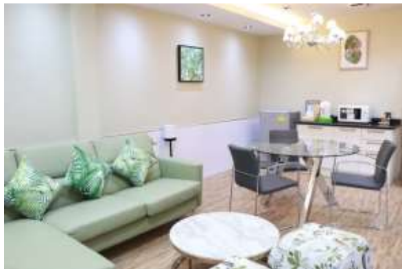
ห้อง Deluxe Superior