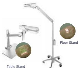
เครื่องส่องเส้นเลือด ( Projection vein Finder )