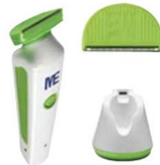
เครื่องกำจัดขนอัตโนมัติ (Surgical Clipper)