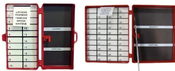
กล่องนับเข็ม และใบมีด ( Needle & Blade Counter )

นโยบายการวิจัยและพัฒนาในด้านต่าง ๆ และรายละเอียดเกี่ยวกับการพัฒนานวัตกรรมในกระบวนการ