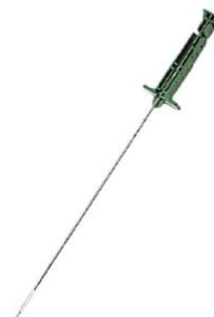
เข็มเจาะชิ้นเนื้อ ( Biopsy Needle )