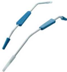
หัวดูดสารคัดหลั่ง สำหรับการผ่าตัดหัวใจ (Cardiac Suction Tip)