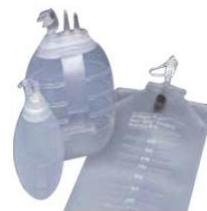
อุปกรณ์รองรับของเหลว จากแผลผ่าตัด (Silicone Bulb Reservoirs)