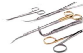
เครื่องมือผ่าตัด ( Surgical Instruments )