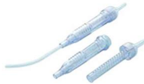
หัวดูดสารคัดหลั่ง สำหรับการผ่าตัดกระดูก (Orthopedics Suction Tip)