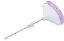
เข็มเจาะไขกระดูก (Strylab Bone Marrow)