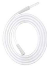
สายดูดสารคัดหลั่ง (Tubing and Suction Handles)