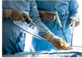
ถุงครอบสายไฟในหัตถการ ส่องกล้องตรวจอวัยวะภายใน (Camera Sleeves)