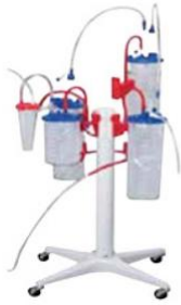
อุปกรณ์ที่ใช้สำหรับดูด และเก็บสารคัดหลั่ง (Suction Liners)