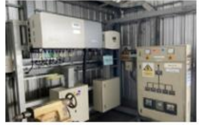
ระบบผลิตพลังงานไฟฟ้า (Solar Energy)