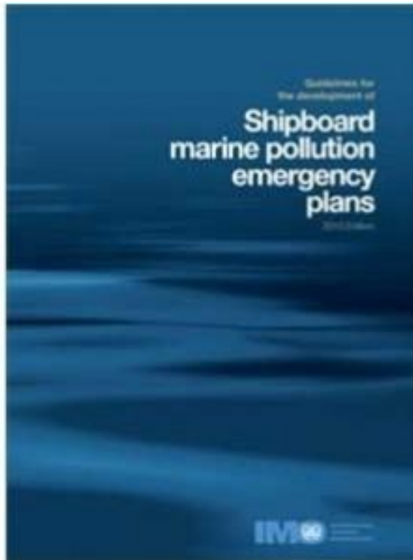
คู่มือบริหารความปลอดภัยของบริษัท