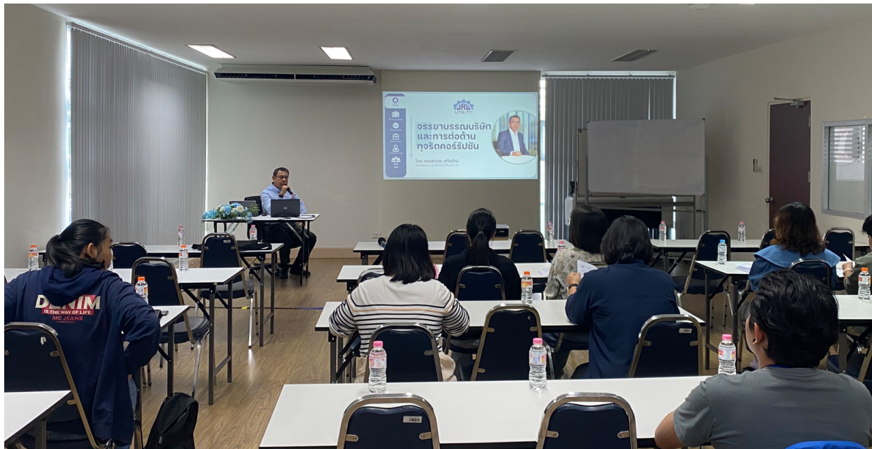
อบรมจรรยาบรรณและการต่อต้านทุจริตคอร์รัปชัน