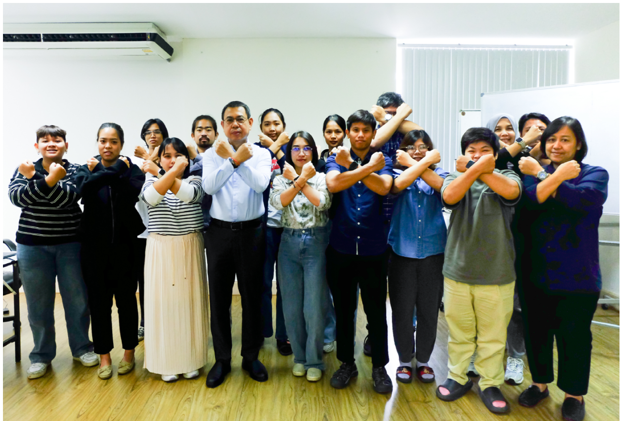
อบรมจรรยาบรรณและการต่อต้านทุจริตคอร์รัปชัน

การดำเนินงานจัดซื้อจัดจ้างของบริษัทต้องเป็นไปอย่างโปร่งใส ซื่อสัตย์ และปฏิบัติตาม ระเบียบการจัดซื้อจัดจ้างของบริษัท และเป็นไปตามกฎหมายและกฎระเบียบที่เกี่ยวข้องกับการจัดซื้อจัดจ้างของทั้งภาครัฐ และเอกชน รวมทั้งกฎหมายที่ห้ามมีความพยายามในการใช้อำนาจอย่างไม่เหมาะสมต่อเจ้าหน้าที่ รวมถึงกฎระเบียบและ ข้อบังคับซึ่งออกโดยสำนักงานคณะกรรมการป้องกันและปราบปรามการทุจริตแห่งชาติ (ปปช.) โดยจัดให้มีการอบรมแก่พนักงานใหม่ และมีการอบรมจรรยาบรรณระหว่างปี เพื่อช่วยให้ทุกฝ่ายได้ยึดถือปฏิบัติตามอย่างเคร่งครัด