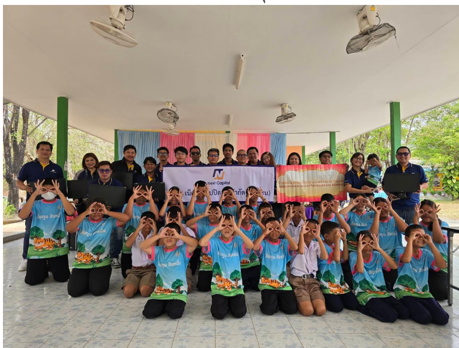
บริจาคคอมพิวเตอร์และทุนการศึกษา