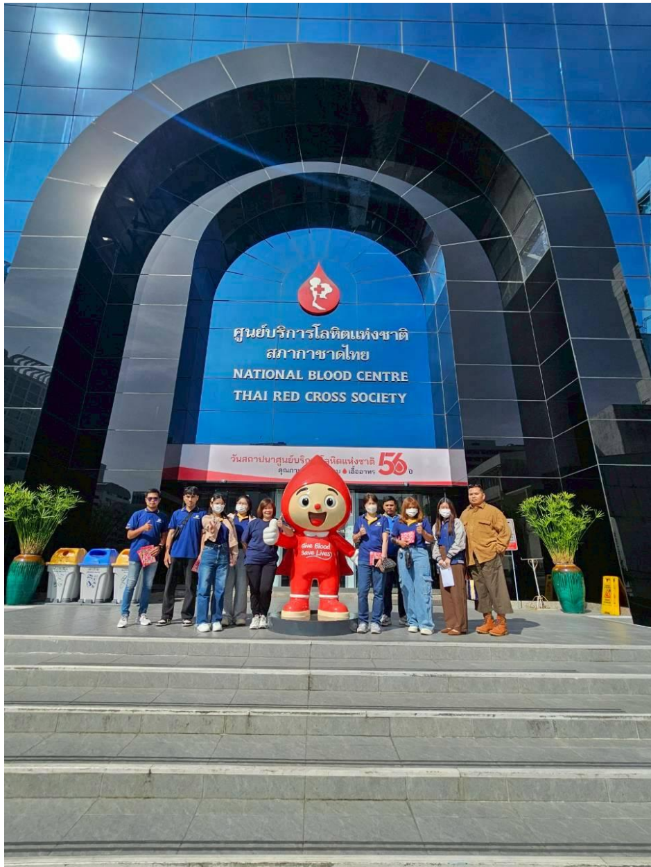
บริจาคโลหิตครั้งที่ 2/2568