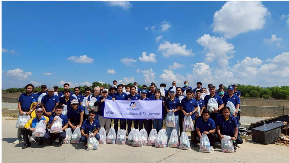
ช่วยเหลือน้ำท่วมภาคใต้