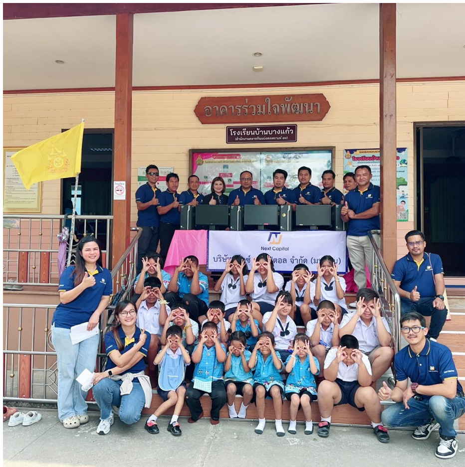
บริจาคคอมพิวเตอร์และทุนการศึกษา