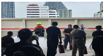
จัดอบรมและซ้อมอพยพกรณีแผ่นดินไหว ประจำปี 2568