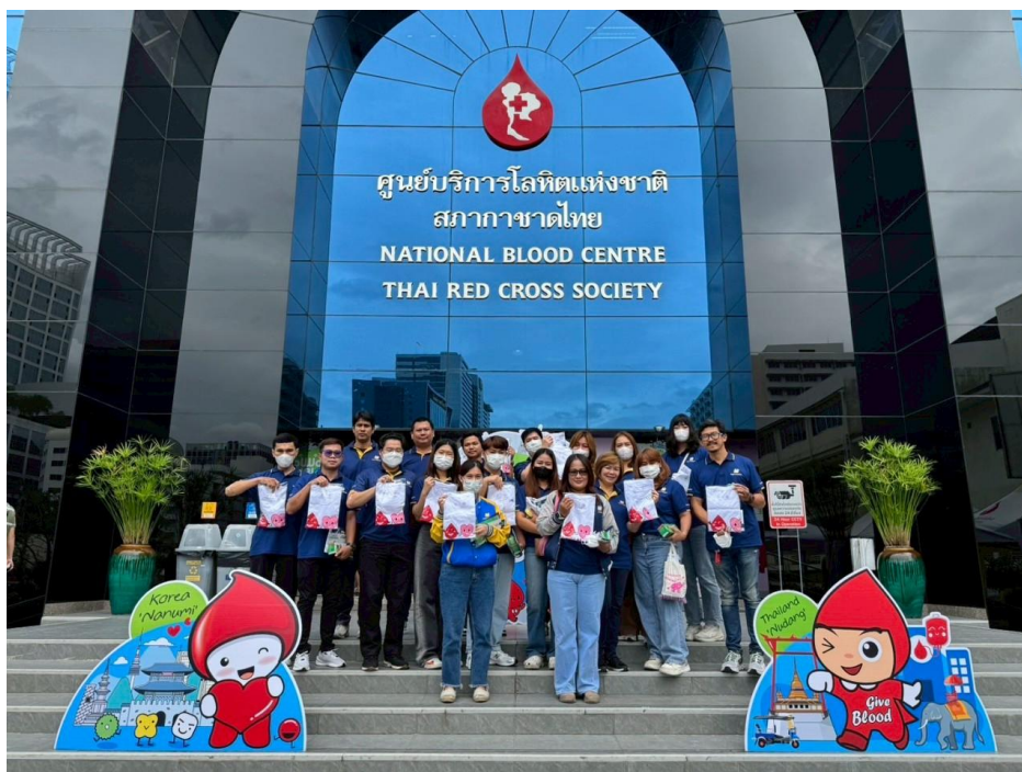
บริจาคตโลหิตครั้งที่ 1/2568