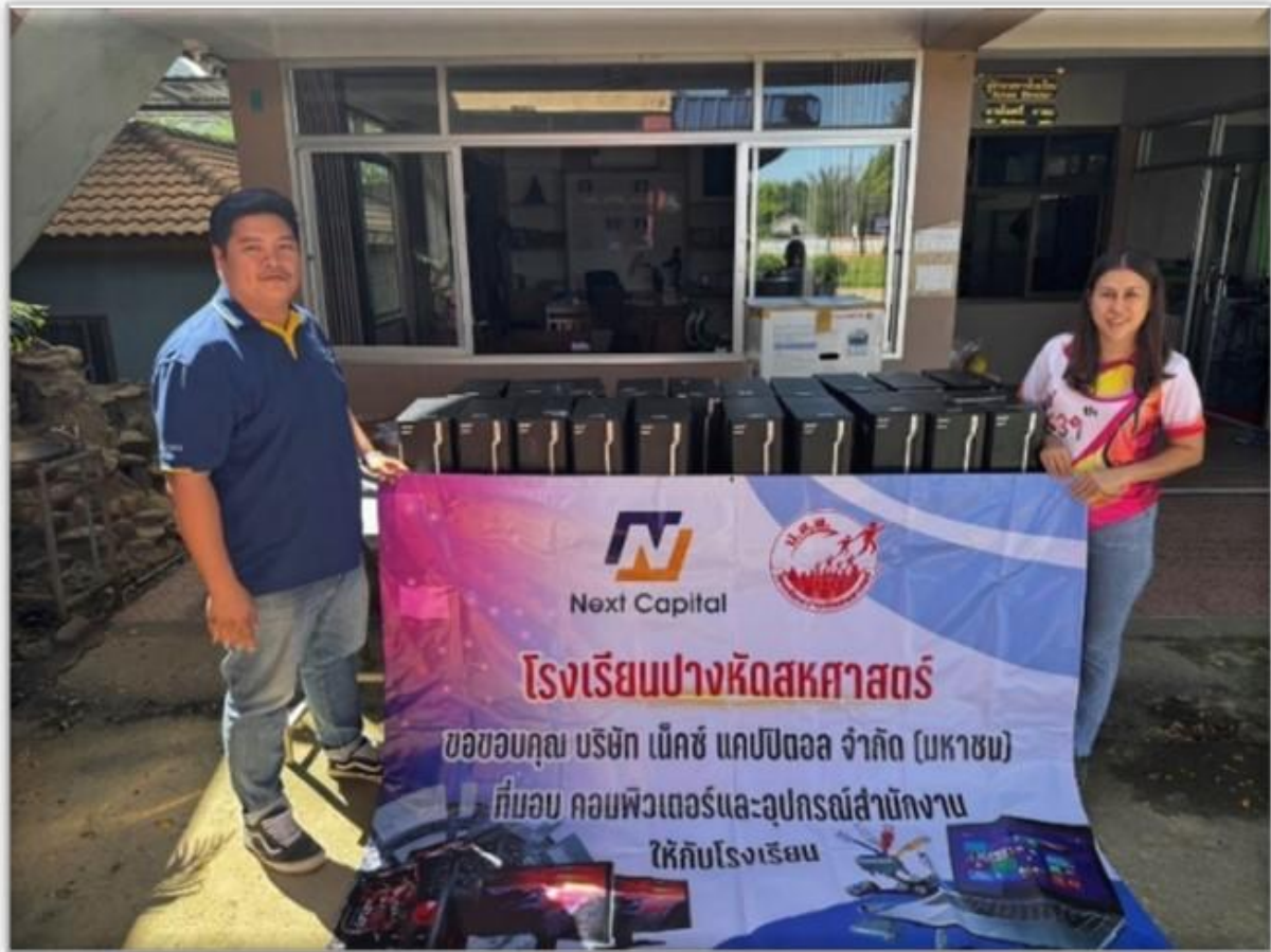
บริจาคคอมพิวเตอร์ให้โรงเรียนที่ประสบอุทกภัย