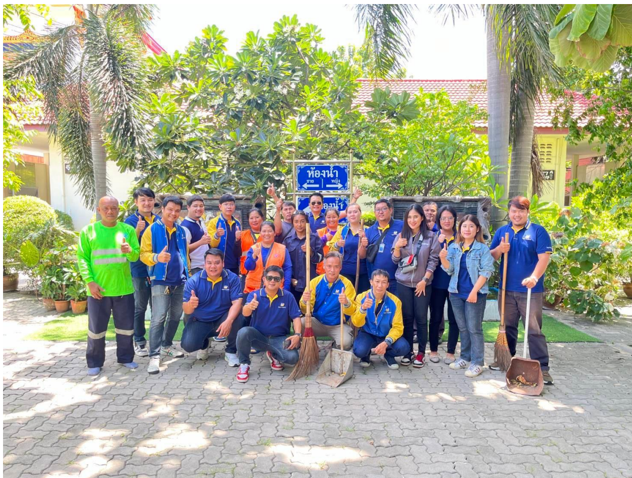
กิจกรรมทำบุญและรักษาความสะอาดวัด