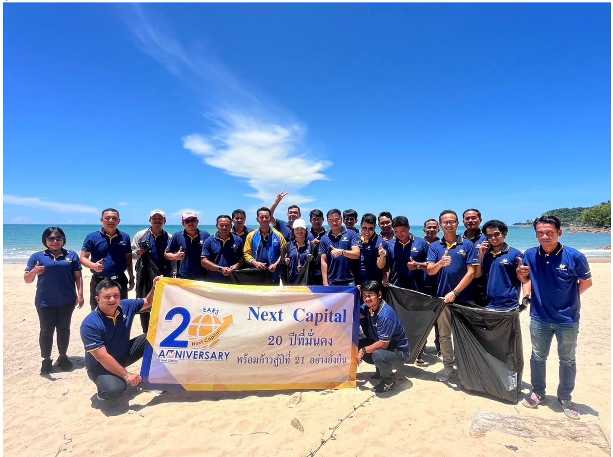
แบ่งปันน้ำใจ สร้างรอยยิ้ม สู่ชายหาดสะอาด

รูปภาพผลการดำเนินงานและผลลัพธ์ด้านการจัดการชุมชนและสังคม