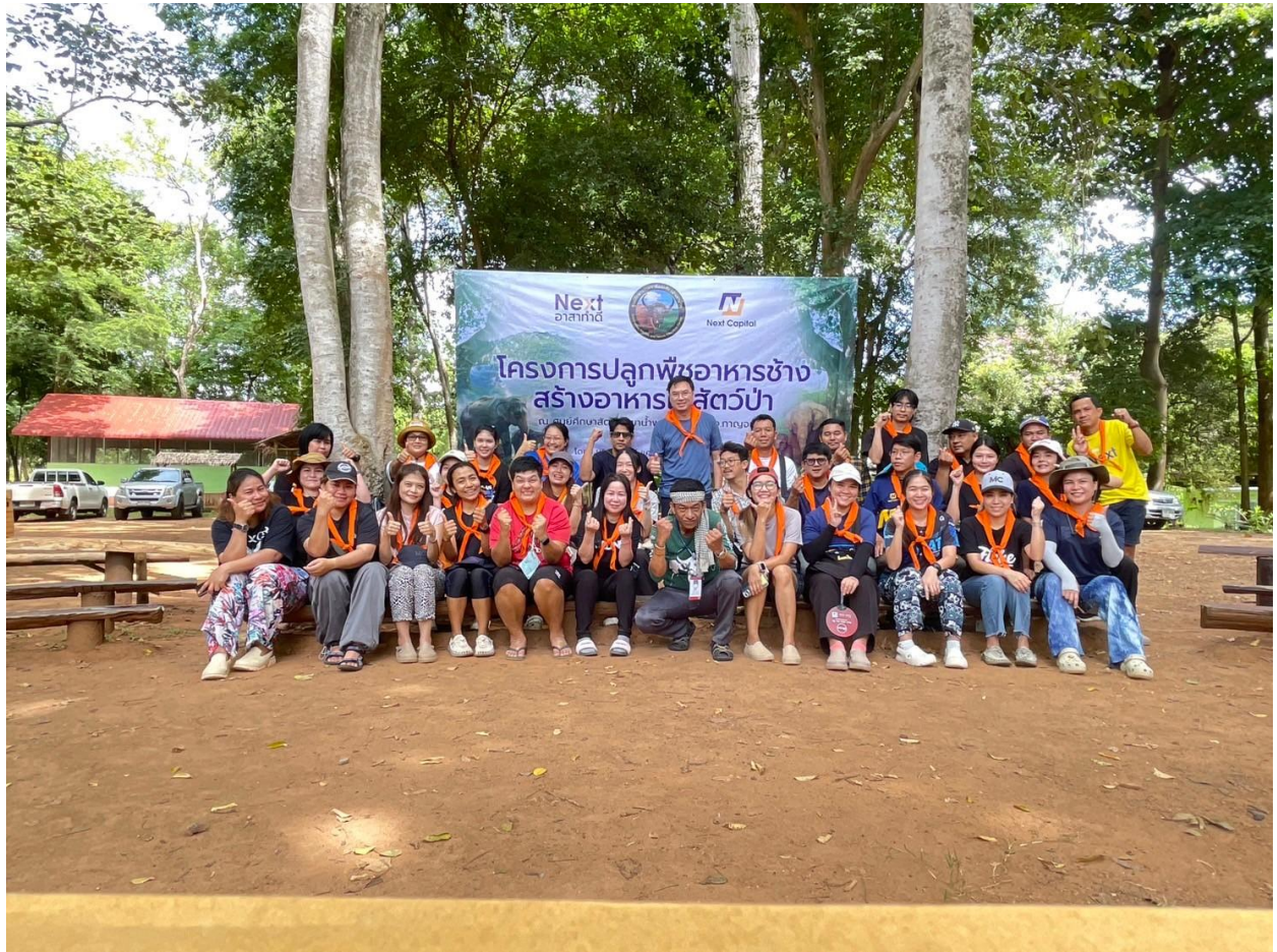
โครงการปลูกพืชอาหารช้าง สร้างอาหารให้สัตว์ป่า