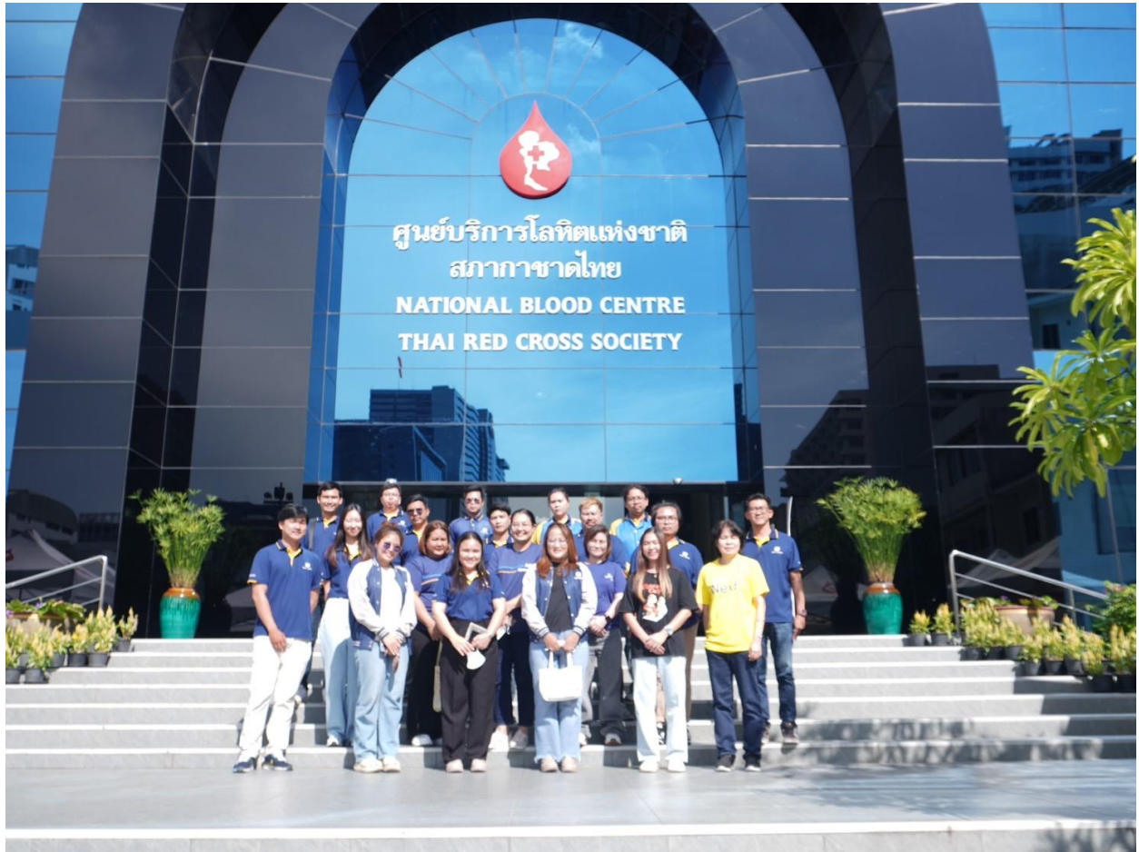
บริจาคโลหิตแก่สภากาชาดไทย