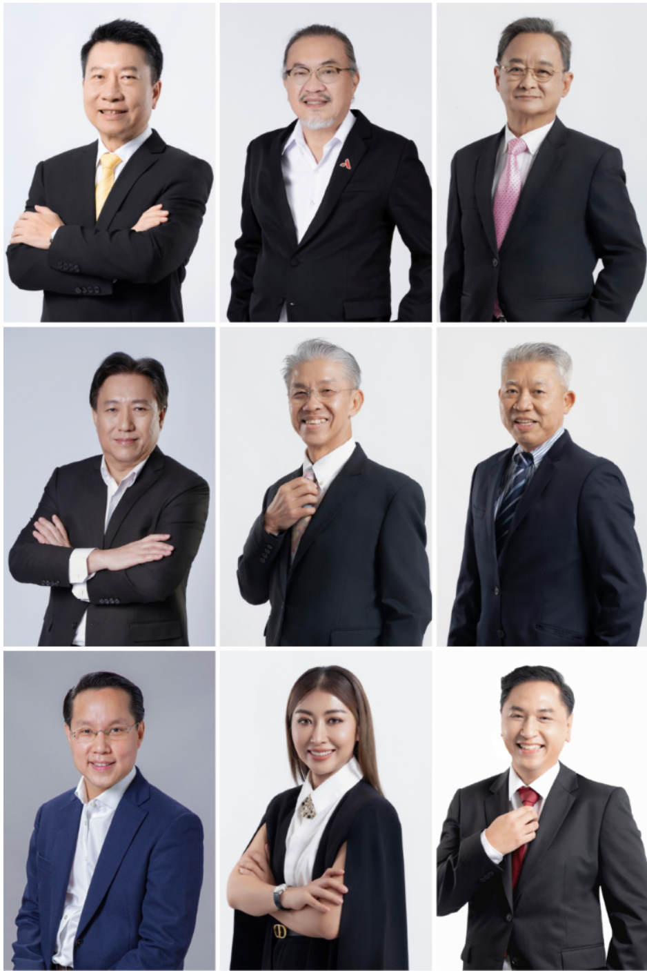
คณะกรรมการบริษัท ( เรียงจากซ้ายไปขวา )