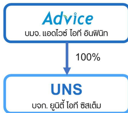
แผนผังโครงสร้างการถือหุ้นของกลุ่มบริษัท