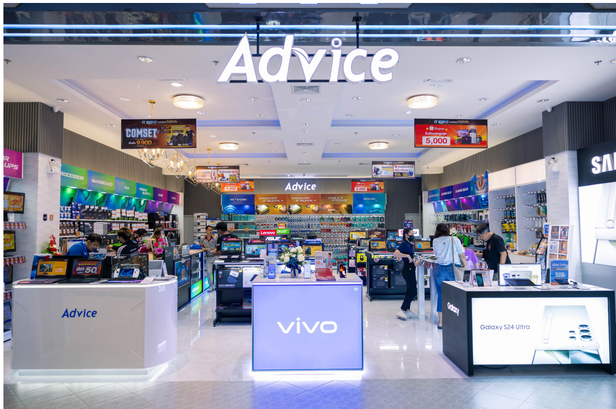
จำนวนสาขาที่บริษัทเป็นเจ้าของ