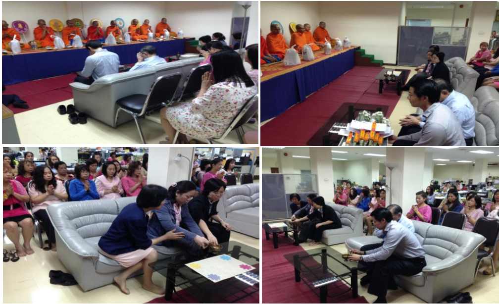
ประธานกรรมการ ผู้บริหาร และพนักงาน บริษัท นิวซีดี (กรุงเทพฯ) จำกัด (มหาชน) ได้ร่วมทำบุญในวันขึ้นปีใหม่ เพื่อความเป็นสิริมงคล และธำรงไว้ซึ่งวัฒนธรรมประเพณีทางศาสนา