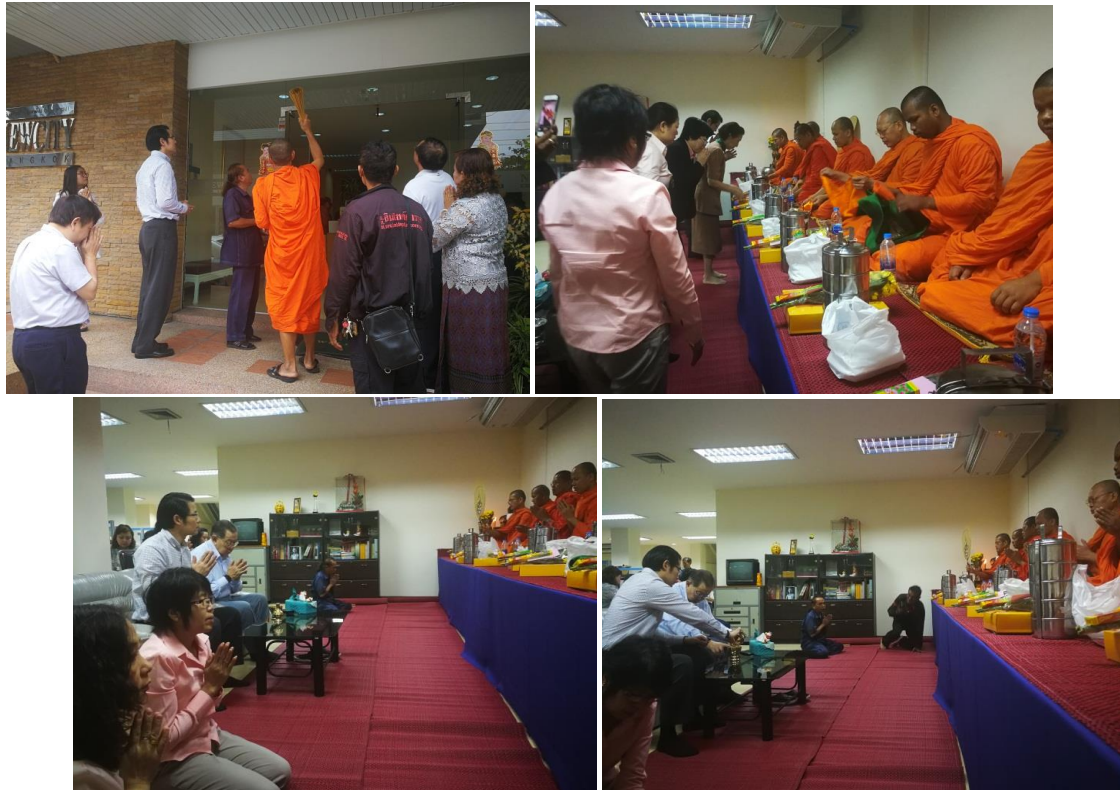
ประธานกรรมการ ผู้บริหาร และพนักงาน บริษัท นิวซิตี้ (กรุงเทพฯ) จำกัด (มหาชน) ได้ร่วมทำบุญในวันขึ้นปีใหม่ เพื่อความเป็นสิริมงคล และสร้างไว้ซึ่งวัฒนธรรมประเพณีทางศาสนา