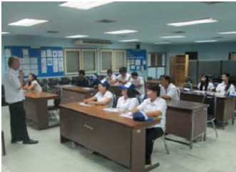
ภาพการปฐมพยาบาลพนักงานใหม่