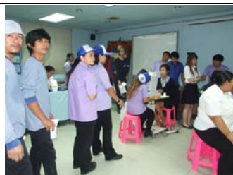
ภาพพนักงานเข้ารับการตรวจสุขภาพ ประจำปี

ตัวแทนคณะกรรมการสวัสดิการบริษัทฯ เข้าเยี่ยมพนักงานที่เจ็บป่วย และหยุดพักรักษาตัว