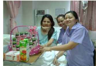
ภาพตัวแทนคณะกรรมการสวัสดิการบริษัทฯ เข้าเยี่ยมพนักงานเจ็บป่วย

บริษัทฯ ได้มีการให้ความรู้ ความเข้าใจกับพนักงานที่จ้างงานใหม่ เพื่อให้ทุกคนรับทราบเกี่ยวกับประวัติความเป็นมาของบริษัทฯ ระเบียบข้อบังคับในการทำงาน, ระบบการจ่ายค่าตอบแทน,สวัสดิการ, ประกันสังคม,ความปลอดภัยในการทำงาน, ระบบคุณภาพ และระบบการจัดการสิ่งแวดล้อม เป็นต้น