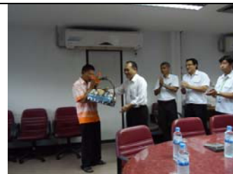
ภาพคณะผู้บริหารขอบคุณพนักงานที่ครบเกษียณอายุการทำงาน

บริษัทฯ ได้เห็นถึงความสำคัญของสุขภาพของพนักงาน จึงได้จัดให้มีการตรวจสุขภาพให้แก่พนักงานทุกคน