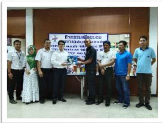
มอบของขวัญวันเด็กสนับสนุนภาครัฐและเอกชน ในพื้นที่เขตมีนบุรี กรุงเทพฯ