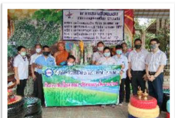
ทอดผ้าป่าเนื่องในเทศกาลวันสงกรานต์ ณ วัดป่าเพ็ญเหนือ