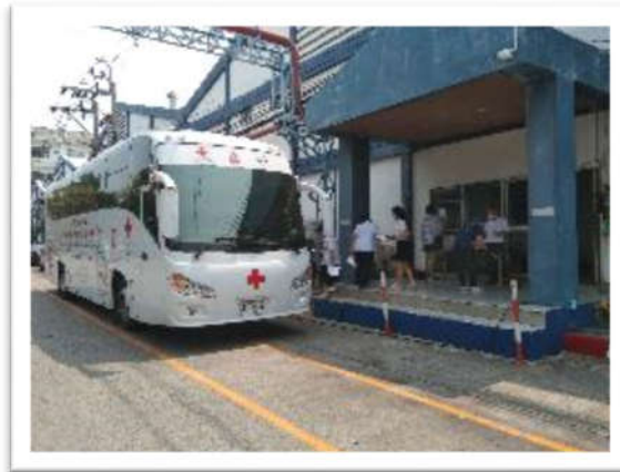
กิจกรรม UPF ร่วมบริจาคโลหิตเพื่อเพื่อนมนุษย์ให้กับ สภากาชาดไทย ณ สาขามีนบุรี เขต บางชัน