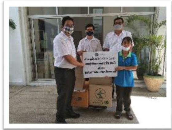
บริจาคปฏิทินเก่าสำหรับใช้ทำสื่อการสอนอักษรเบรลล์ ณ ศูนย์เทคโนโลยีการศึกษาเพื่อคนตาบอด