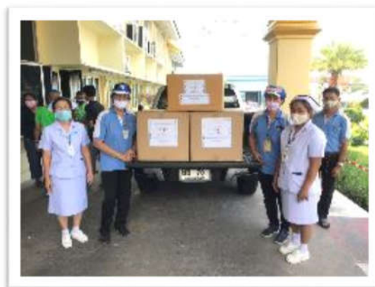
มอบ Face Shield ให้กับเจ้าหน้าที่ทางการแพทย์ ณ โรงพยาบาลชลบุรี