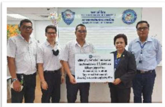
บริจาคเงินช่วยเหลือผู้ประสบอุทกภัย ณ สภากอการค้าไทย