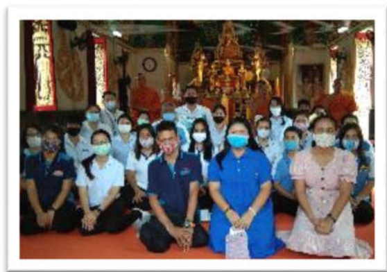
ถวายเทียนเข้าพรรษาและทอดผ้าป่า ณ วัดป่าเพ็ญเหนือ