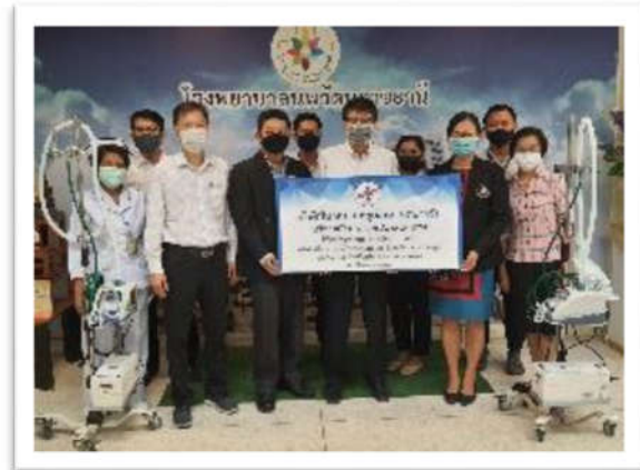
บริจาคเครื่องให้ออกาศผสมออกซิเจนอัตราการไหลสูง ณ โรงพยาบาลพระรัตนารักษ์