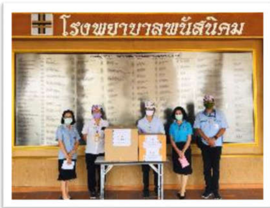
มอบ Face Shield ให้กับเจ้าหน้าที่ทางการแพทย์ ณ โรงพยาบาลพนัสนิคม