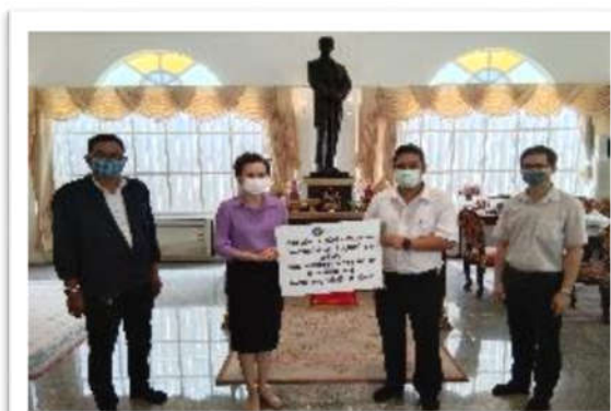
มอบเงินสมทบช่วยเหลือบุคลากรทางการแพทย์ ในการรับมือกับโควิด 19 ณ โรงพยาบาลจุฬาลงกรณ์