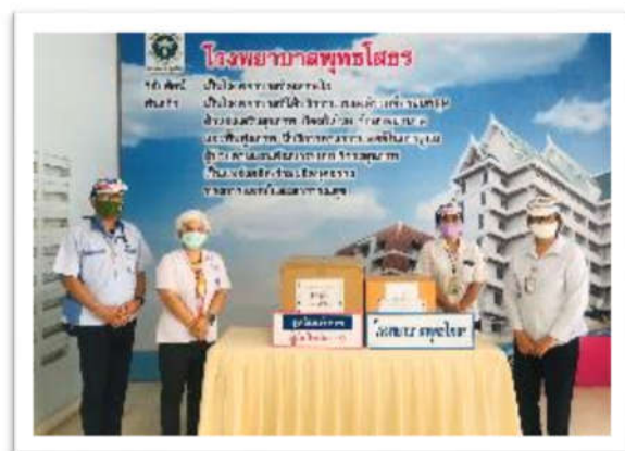
มอบ Face Shield ให้กับเจ้าหน้าที่ทางการแพทย์ ณ โรงพยาบาลพุทธโสธร