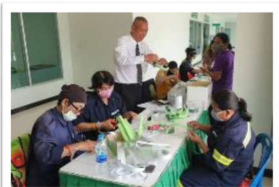
บริจาคยางยืดให้กับสำนักงานเขตวังทองหลาง สำหรับทำ Face Shield ให้เจ้าหน้าที่ของสำนักงานเขต