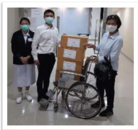
มอบ Face Shield ให้กับเจ้าหน้าที่ทางการแพทย์ ณ โรงพยาบาลราชภัฏจันทรเกษม