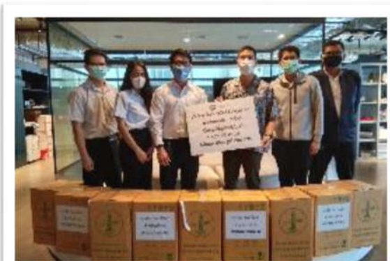
บริจาคยางยืดให้บริษัท วัสดุดีเวลด์ จำกัด สำหรับทำ Face Shield มอบให้เจ้าหน้าที่ทางการแพทย์