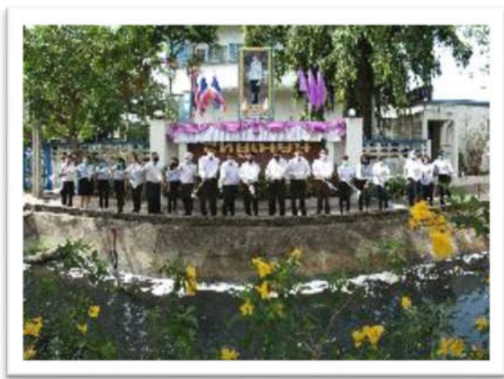
กิจกรรมวันสิ่งแวดล้อมโลก เทน้ำ EM รักษาสภาพน้ำ บริเวณหน้าบริษัทฯ ในกลุ่มสาหร่ายเนี่ยน เขตบางชัน