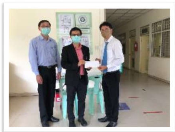
บริจาคเงินช่วยเหลือในการดูแลผู้ป่วยโควิด 19 ณ สาธารณสุขชะเชิงเทรา