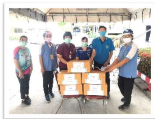
มอบ Face Shield ให้กับเจ้าหน้าที่ทางการแพทย์ ณ โรงพยาบาลบางปะกง