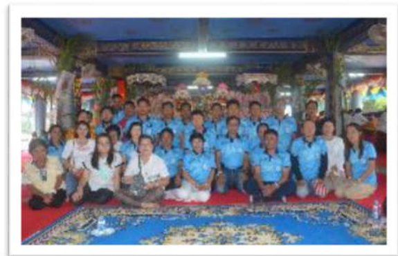
ทอดกฐินเนื่องในวันออกพรรษา ณ วัดป่าสว่างภิรมย์ จังหวัดสกลนคร