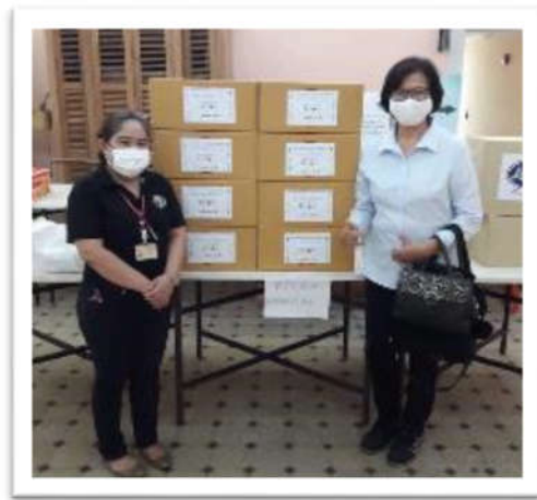
มอบ Face Shield ให้กับเจ้าหน้าที่ทางการแพทย์ ณ โรงพยาบาลในพื้นที่บางปะกง