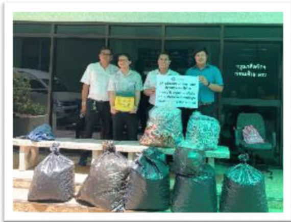
บริจาคฝาวัดน้ำ กระป๋องอลูมิเนียมสำหรับทำขาเทียม ณ กรมควบคุมมลพิษ