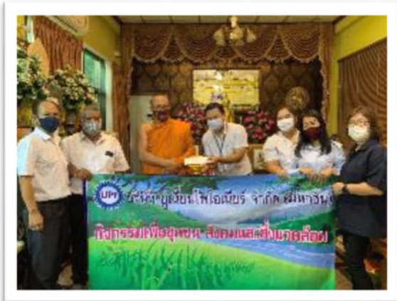
ถวายเงินวันวิสาขบูชา ณ วัดป่าเพ็ญเหนือ