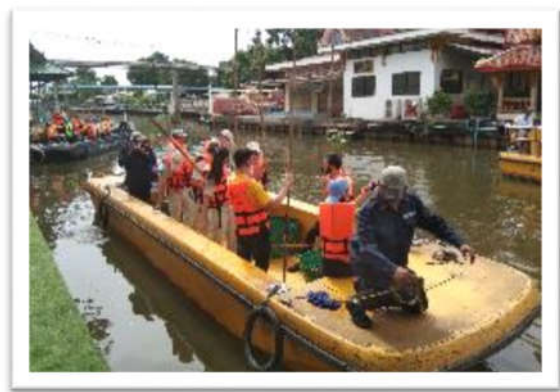
กิจกรรมทำความสะอาดและกำจัดวัชพืชในลำคลอง ณ คลองแสนแสบ วัดป่าเพ็ญเหนือ