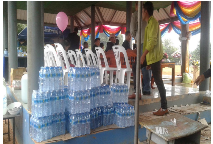
ร่วมพิธีเปิดงานกีฬานักเรียนรวมถึงจัดเตรียมน้ำดื่มสะอาดให้แก่เด็กนักเรียน