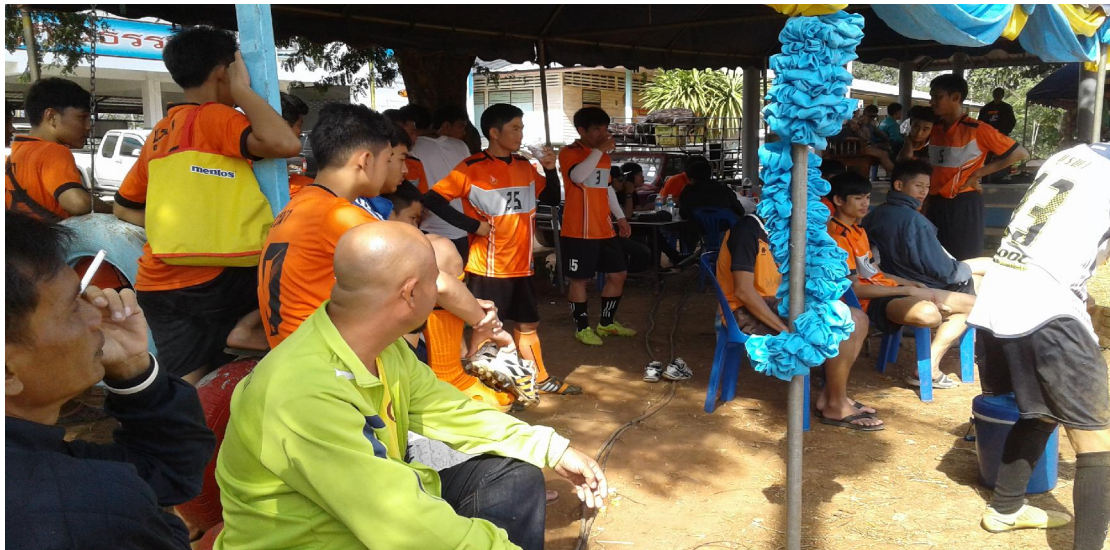
บรรยากาศผู้เข้าร่วมงานเตรียมตัวลงแข่งในแมตช์ต่อไป