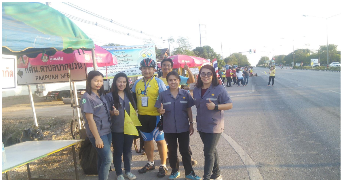
ทีมงานถ่ายภาพกับน้องปั่นที่มารับบริการน้ำดื่มสะอาด