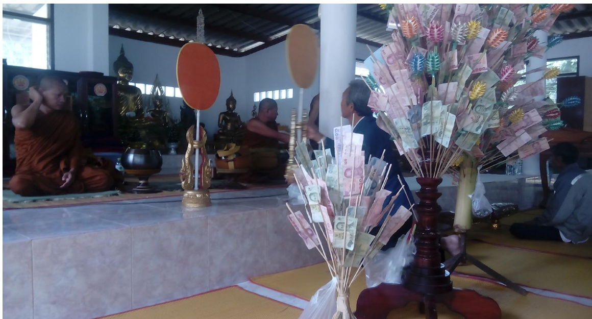
ปัจจัยร่วมถวายงานผ้าป่าในครั้งนี้