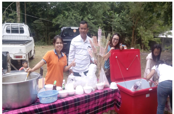
ทีมงานได้ร่วมทำอาหารและบริการคักอาหารให้แก่ผู้ร่วมงานด้วยรอยยิ้มที่แจ่มใส