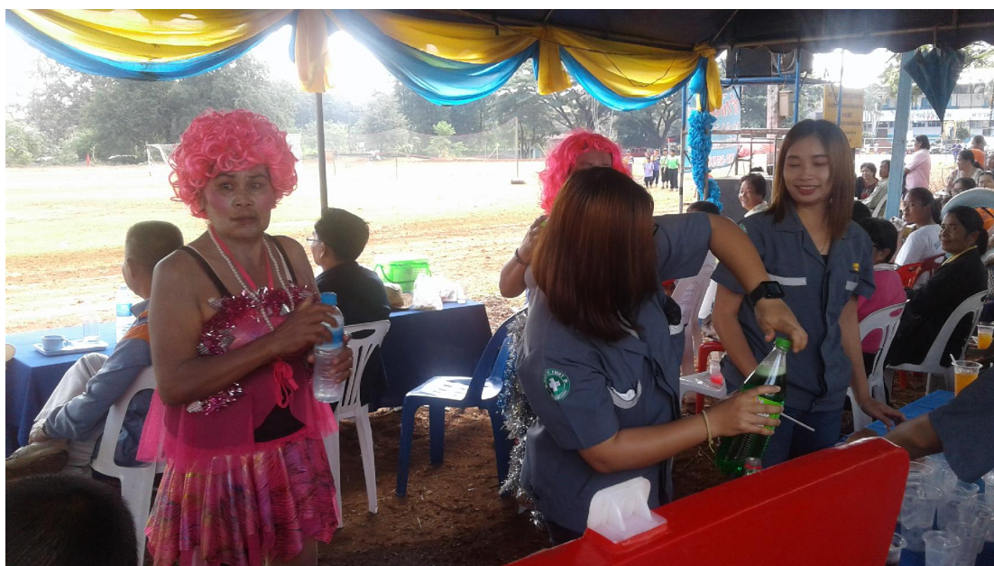
ทีมงาน CSR ร่วมจัดเตรียมน้ำอัดลมที่เตรียมมาให้แก่น้องนักเรียนด้วยความขมักเขม้น