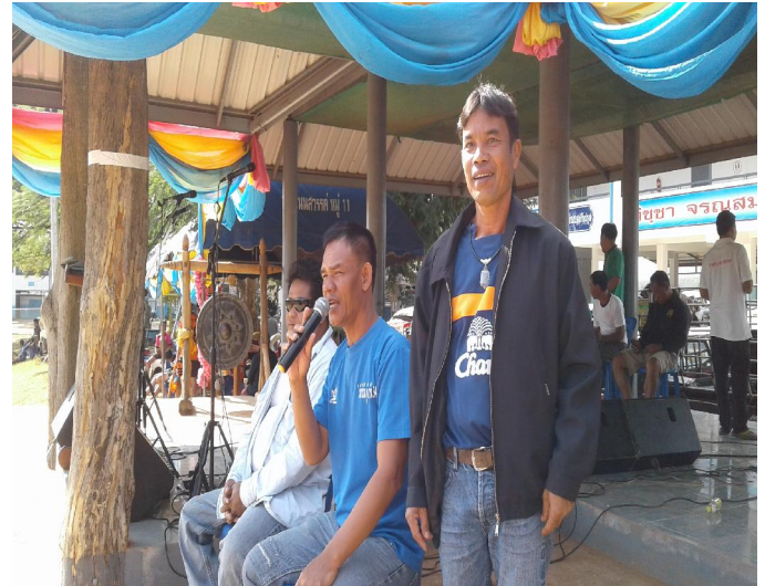
ประจำการเตรียมพร้อมจุดน้ำดื่มน้ำไว้ให้บริการแก่ผู้ร่วมงาน