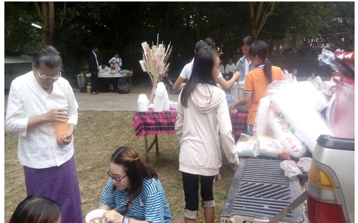
บรรพชาศในงานได้มีไปด้วยผู้มีจิตศรัทธาเข้าร่วมทำบุญ