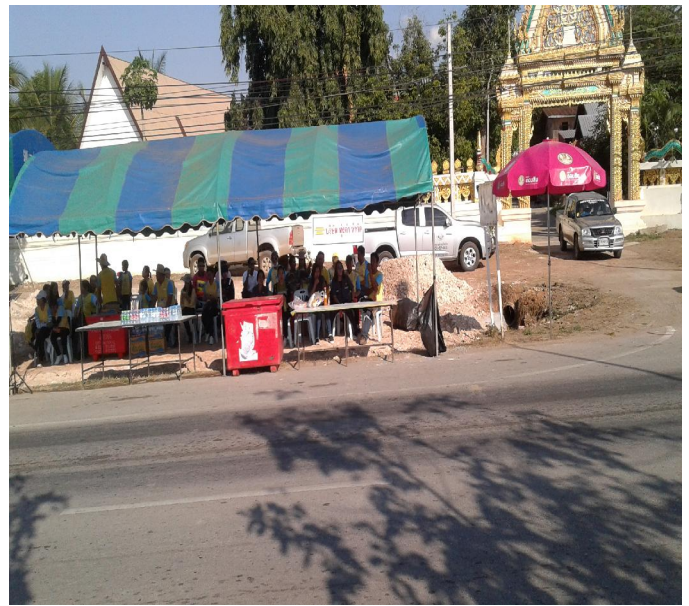
ทีมงานยื่นประจำซุ่มน้ำเพื่อรอให้บริการแก่นักปั่นที่ผ่านมา