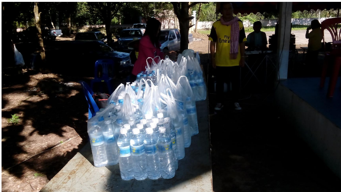
กิจกรรมมอบน้ำดื่มงานกีฬาโรงเรียนบ้านน้ำทบ