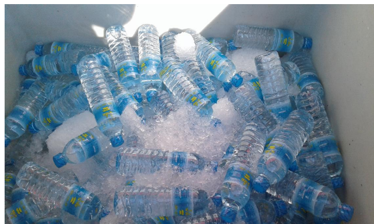
น้ำดื่มเย็นๆจัดไว้เพื่อให้บริการ