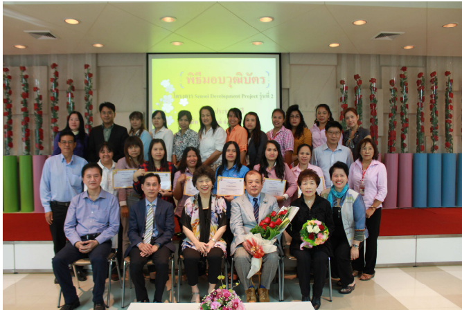
งานพิธีมอบใบประกาศนียบัตรให้แก่ครูฝึก ผู้ผ่านการพัฒนาทักษะสำเร็จตาม หลักสูตรของโครงการ

ขับเคลื่อน ผลสัมผสวนการแลกเปลี่ยนประสบการณ์ และการแก้ปัญหาในงานร่วมกัน