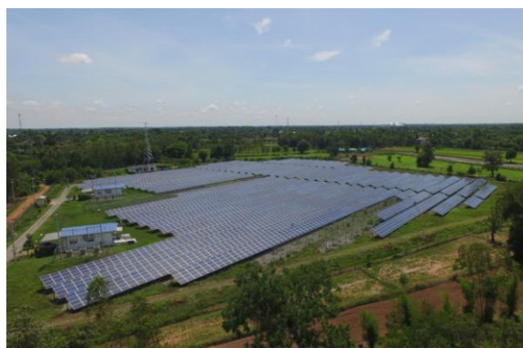
โครงการชันพาร์ค 2 (กาฬสินธุ์)