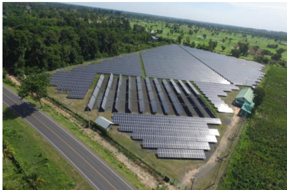
โครงการ UP (ศรีสะเกษ)