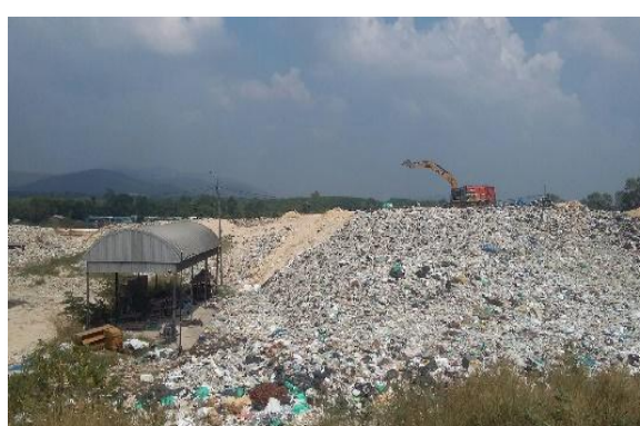
โครงการคลีนซิตี้ (ชลบุรี)