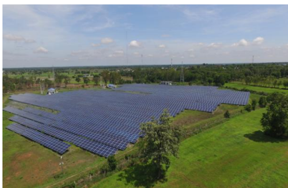
โครงการชันพาร์ค (กาฬสินธุ์)