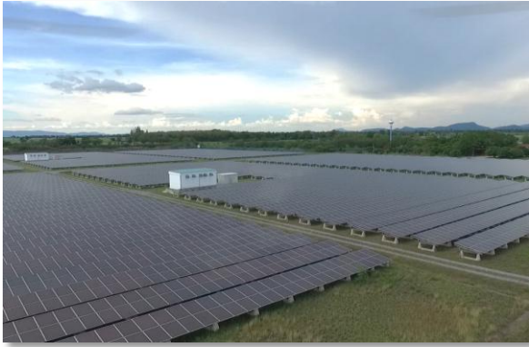
โครงการสแกน อินเตอร์ พาร์อีสท์ (ลพบุรี)