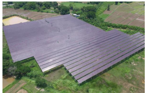
โครงการสมภูมิโซล่า (หนองคาย)