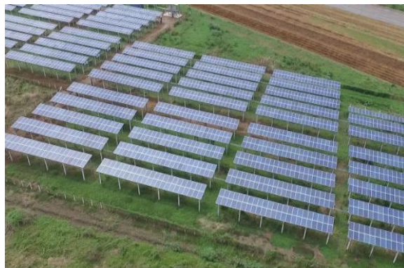
โครงการซีอาร์ โซลาร์ (บางบัวทอง)