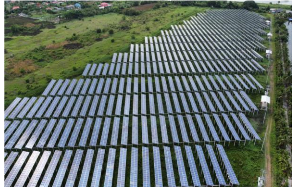
โครงการสแกน อินเตอร์ พาร์อีสท์ (หนองจอก)