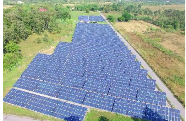
โครงการวังการคำรุ่งโรจน์ (ขอนแก่น)