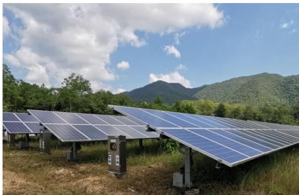
โครงการซีอาร์ โซลาร์ (ลำปาง)