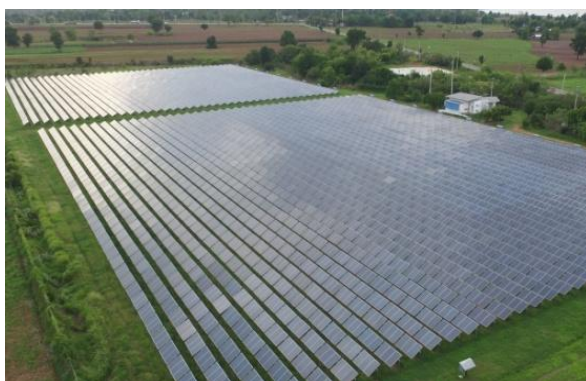
โครงการ IS (นครราชสีมา)