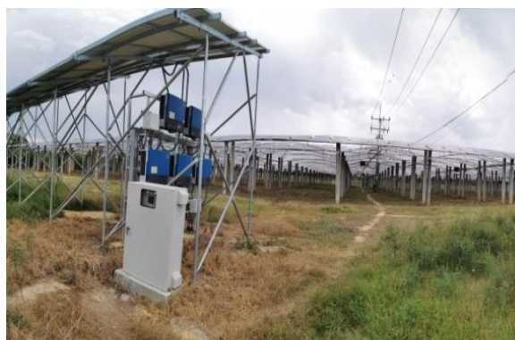
โครงการ GE (ประจวบคีรีขันธ์)