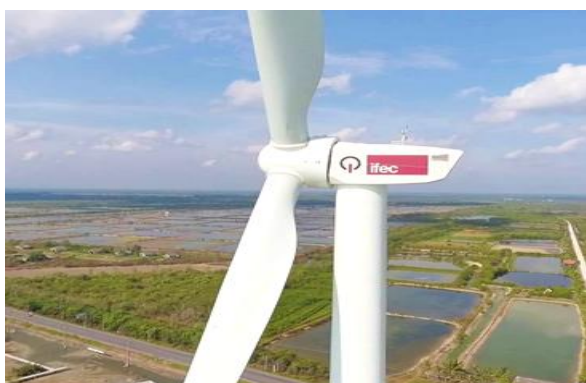
โครงการพลังงานลม Iwind