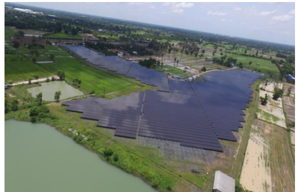
โครงการเจพี โซลาร์ (สุรินทร์)