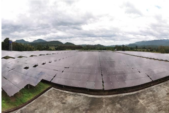
โครงการแม่สะเรียง โซลา (แม่ฮ่องสอน)