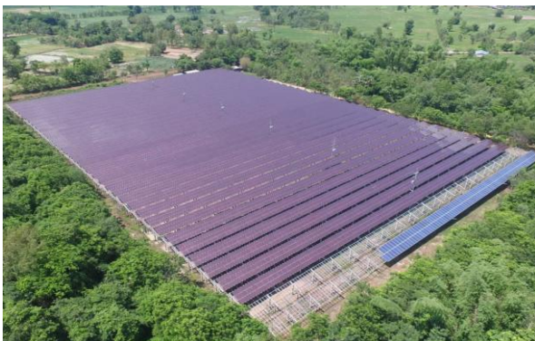
โครงการสมประสงค์ฯ (อุดรธานี)