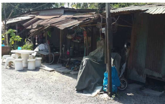
บ้านพักคนงานก่อนปรับปรุง