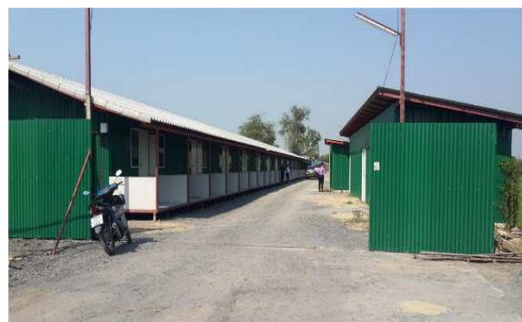
บ้านพักคนงานหลังปรับปรุง