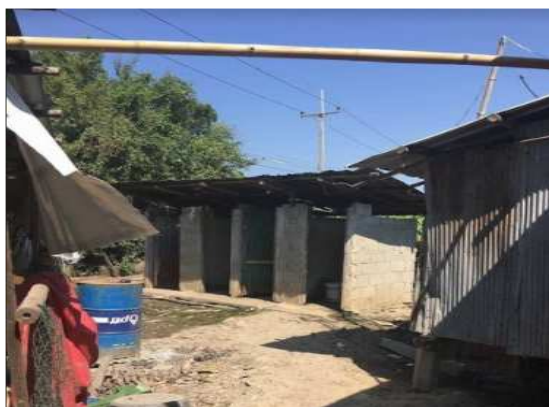
ห้องน้ำก่อนปรับปรุง