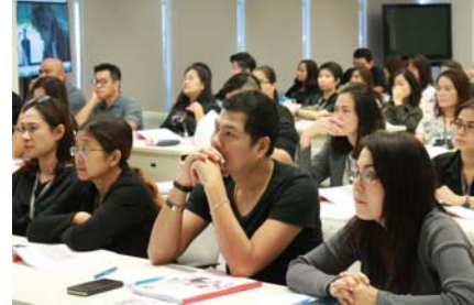
อบรม : เจ้าหน้าที่ความปลอดภัยในการทำงาน ระดับหัวหน้างาน

อบรมด้านความปลอดภัยในการทำงาน ระดับบริหาร จุดประสงค์เพื่อการบริหารจัดการความปลอดภัยในการทำงาน และบทบาทหน้าที่ของเจ้าหน้าที่ความปลอดภัยในการทำงาน ระดับบริหาร รวมถึงกฎหมายความปลอดภัยอาชีวอนามัย และสภาพแวดล้อมในการทำงานของกระทรวงแรงงาน