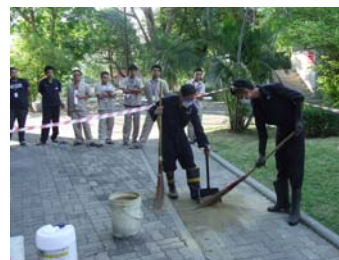
อบรม : ความปลอดภัยในการทำงานเกี่ยวกับสารเคมี