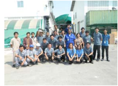
อบรม : การใช้และบำรุงรักษารถยกเพื่อความปลอดภัย