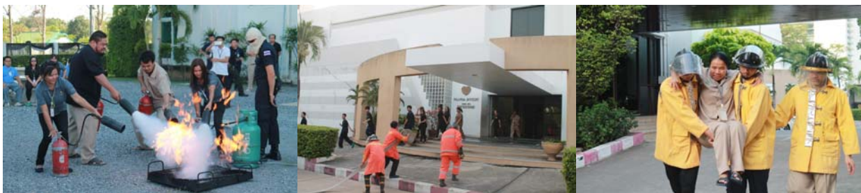
อบรม : ดับเพลิงขั้นต้นและฝึกซ้อมอพยพหนีไฟ

บริษัทฯ มีการทบทวนและดำเนินการซักซ้อมแผนโต้ตอบภาวะกรณีเกิดเหตุฉุกเฉิน เช่น การฝึกซ้อมดับเพลิงและฝึกอพยพหนีไฟ เพื่อให้พนักงานทราบถึงขั้นตอนการดับเพลิงและวิธีการหนีไฟ หากมีเหตุฉุกเฉินกรณีเกิดเหตุเพลิงไหม้ การฝึกซ้อมระดับเหตุการณ์ร้ายแรงเพื่อให้พนักงานทราบแนวทางการปฏิบัติเมื่อเกิดเหตุการณ์ร้ายแรงและบทบาทหน้าที่ของผู้ที่เกี่ยวข้อง เป็นต้น