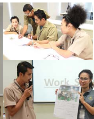
อบรม: ความปลอดภัยในการทำงานเกี่ยวกับเสียง

อบรมความปลอดภัยในการทำงานเกี่ยวกับสารเคมี มีจุดประสงค์เพื่อให้พนักงานทราบถึงวิธีการทำงานเกี่ยวกับสารเคมีอย่างปลอดภัย วิธีการป้องกันและการปฐมพยาบาลเมื่อได้รับอันตรายจากสารเคมี