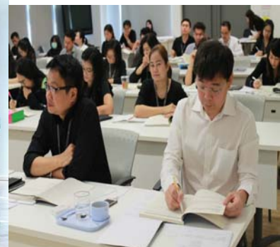
อบรม : เจ้าหน้าที่ความปลอดภัยในการทำงาน ระดับบริหาร

เป้าหมายและผลการดำเนินการด้านความปลอดภัยอาชีวอนามัย และสภาพแวดล้อมในการทำงาน