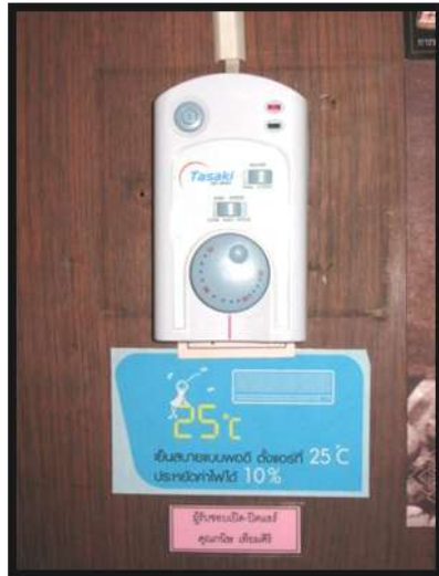
ป้ายรณรงค์การใช้เครื่องปรับอากาศ