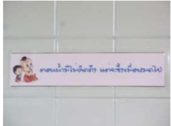
ป้ายรณรงค์การประหยัดน้ำ (ติดอยู่ภายในห้องน้ำของบริษัทฯ)