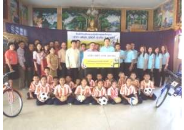
มอบทุนการศึกษา และอุปกรณ์กีฬา ให้แก่โรงเรียนวัดสันป่าสัก จังหวัดลำพูน