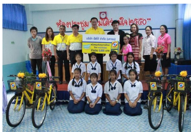
มอบทุนการศึกษา และอุปกรณ์กีฬาให้แก่ โรงเรียนบ้านริมใต้ จังหวัดเชียงใหม่