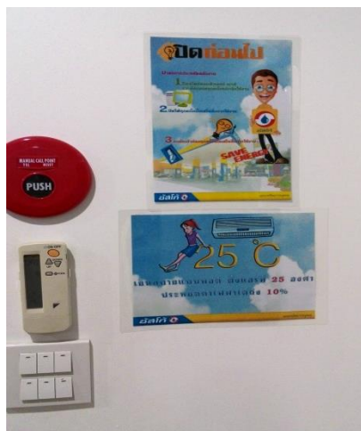
ป้ายรณรงค์การประหยัดไฟฟ้า

ตั้งแต่ปี 2547 บริษัทฯ และบริษัทย่อยได้จัดให้มีโครงการรณรงค์อนุรักษ์พลังงาน โดยให้พนักงานมีส่วนร่วมในการกำหนดมาตรการการประหยัดพลังงานด้วยวิธีต่างๆ เช่น การปิดไฟและเครื่องปรับอากาศในช่วงเวลาพักกลางวัน และก่อนเวลาเลิกงานครึ่งชั่วโมงของทุกวันทำการ การประหยัดการใช้กระดาษในทุกรูปแบบ ผลของโครงการนี้ ได้ช่วยทำให้พนักงานเข้าใจบทบาท และมีส่วนร่วมอย่างภาคภูมิใจในการใช้พลังงานอย่างประหยัด เพื่อช่วยลดสภาวะโลกร้อน ทั้งยังสามารถลดค่าใช้จ่ายในส่วนของการใช้พลังงานและทรัพยากรได้อย่างเป็นรูปธรรมอีกด้วย