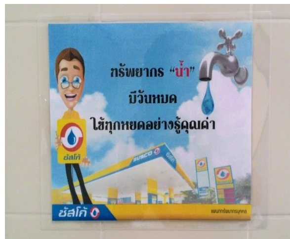
ป้ายรณรงค์การประหยัดน้ำ (ติดอยู่ภายในห้องน้ำของบริษัทฯ)