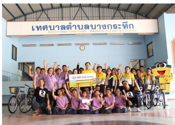
มอบทุนการศึกษา และอุปกรณ์กีฬาให้แก่ โรงเรียนคลองบางกระพิก จังหวัดนครปฐม

“เทวดาตัวน้อย” ผู้ได้รับทุนการศึกษาจะส่งจดหมายเล่าเรื่องราวต่างๆ เกี่ยวกับชีวิตและความเป็นอยู่ของตนให้บริษัทฯ หรือบริษัทย่อย ผู้ให้ทุนทราบเป็นระยะๆ ซึ่งเป็นเรื่องที่บริษัทฯ บริษัทย่อย และพนักงานมีความยินดีและภูมิใจเป็นอย่างยิ่ง ที่ได้รับทราบถึงผลดีของโครงการที่มีต่อเด็กผู้ได้รับความช่วยเหลือเหล่านั้น ตลอดระยะเวลา 6 ปีที่บริษัทฯ และบริษัทย่อยได้จัดทำโครงการนี้ ได้มอบทุนการศึกษาให้กับเด็กนักเรียนจำนวน 124 คน จากโรงเรียนในภาคต่างๆ ของประเทศ