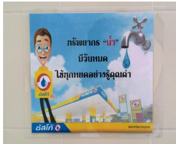
ป้ายรณรงค์การประหยัดน้ำ (ติดอยู่ภายในห้องน้ำของบริษัทฯ)