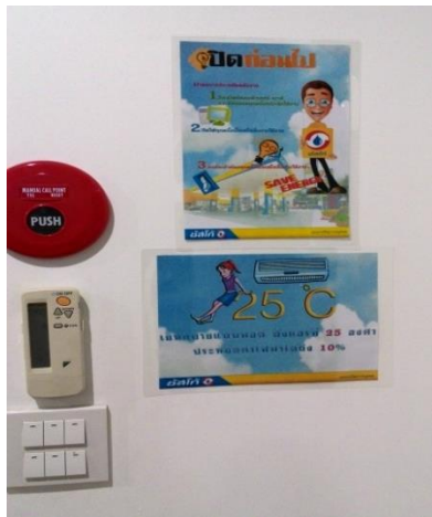
ป้ายรณรงค์การประหยัดไฟฟ้า

ตั้งแต่ปี 2547 บริษัทฯ และบริษัทย่อยได้จัดให้มีการโครงการรณรงค์อนุรักษ์พลังงาน โดยให้พนักงานมีส่วนร่วมในการกำหนดมาตรการการประหยัดพลังงานด้วยวิธีต่างๆ เช่น การปิดไฟและเครื่องปรับอากาศในช่วงเวลาพักกลางวัน และก่อนเวลาเลิกงานครึ่งชั่วโมงของทุกวันทำการ การประหยัดการใช้กระดาษในทุกรูปแบบ ผลของโครงการนี้ ได้ช่วยทำให้พนักงานเข้าใจบทบาท และมีส่วนร่วมอย่างภาคภูมิใจในการใช้พลังงานอย่างประหยัด เพื่อช่วยลดสถานะโลกร้อน ทั้งยังสามารถลดค่าใช้จ่ายในส่วนของการใช้พลังงานและทรัพยากรได้อย่างเป็นรูปธรรมอีกด้วย