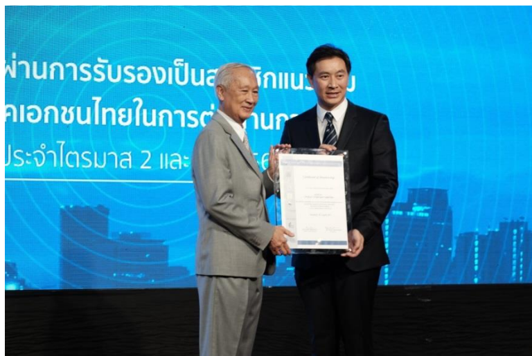
เมื่อวันที่ 18 สิงหาคม 2560 บริษัทฯ ได้รับการรับรองจากแนวร่วมปฏิบัติของภาคเอกชนไทย ในการต่อต้านทุจริต และได้รับมอบใบรับรองในวันที่ 21 พฤศจิกายน 2560