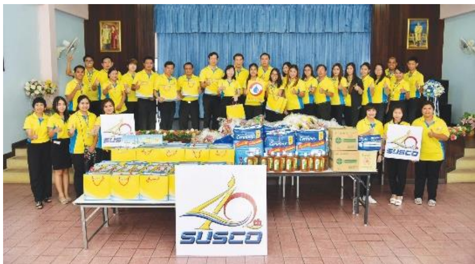
เมื่อวันที่ 25 กันยายน 2560 บริษัทฯ ได้บริจาคของใช้ที่จำเป็นและแจกอาหารว่างให้คนพิการ ณ สถานคุ้มครองและพัฒนาคนพิการ จังหวัดสมุทรปราการ

นอกเหนือจากโครงการต่างๆ ที่บริษัทฯ ได้ดำเนินการอย่างต่อเนื่องดังที่กล่าวข้างต้น บริษัทฯ ยังช่วยเหลือสังคมตามวาระโอกาสต่างๆ อีกด้วย เช่น การสนับสนุนเงินทุนส่งเสริมด้านกีฬา การบริจาคเงินและสิ่งของให้กับองค์กรการกุศลต่างๆ เป็นต้น