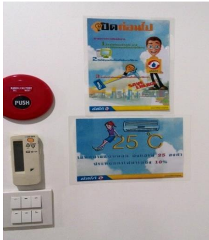
ป้ายรณรงค์การประหยัดไฟฟ้า

ตั้งแต่ปี 2547 บริษัทฯ และบริษัทย่อยได้จัดให้มีโครงการรณรงค์อนุรักษ์พลังงานและสิ่งแวดล้อม โดยให้พนักงานมีส่วนร่วมในการกำหนดมาตรการการประหยัดพลังงานด้วยวิธีต่างๆ เช่น การปิดไฟและเครื่องปรับอากาศในช่วงเวลาพักกลางวัน และก่อนเวลาเลิกงานครึ่งชั่วโมงของทุกวันทำการ การประหยัดการใช้กระดาษในทุกรูปแบบ ผลของโครงการนี้ ได้ช่วยทำให้พนักงานเข้าใจบทบาท และมีส่วนร่วมอย่างภาคภูมิใจในการใช้พลังงานอย่างประหยัด เพื่อช่วยลดสภาวะโลกร้อน ทั้งยังสามารถลดค่าใช้จ่ายในส่วนของการใช้พลังงานและทรัพยากรได้อย่างเป็นรูปธรรมอีกด้วย