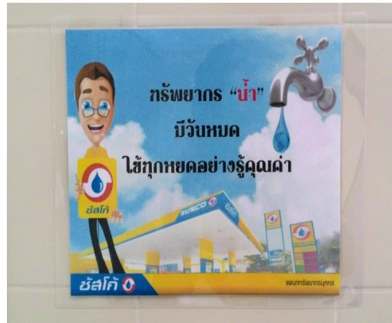
ป้ายรณรงค์การประหยัดน้ำ (ติดอยู่ภายในห้องน้ำของบริษัทฯ)

นอกเหนือจากโครงการต่างๆ ที่บริษัทฯ ได้ดำเนินการอย่างต่อเนื่องดังที่กล่าวข้างต้น บริษัทฯ ยังช่วยเหลือสังคมตามวาระโอกาสต่างๆ อีกด้วย เช่น การสนับสนุนเงินทุนส่งเสริมด้านกีฬา การบริจาคเงินและสิ่งของให้กับองค์กรการกุศลต่างๆ เป็นต้น