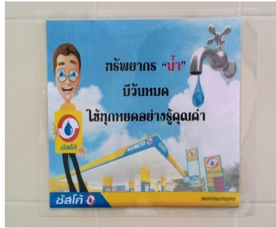
ป้ายรณรงค์การประหยัดน้ำ (ติดอยู่ภายในห้องน้ำของบริษัทฯ)