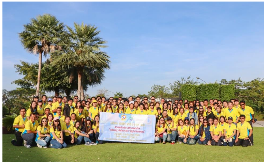
กิจกรรม CSR “ปล่อยปลา ปลูกป่าชายเลน” ณ อุทยานสิ่งแวดล้อมนานาชาติสิรินธร