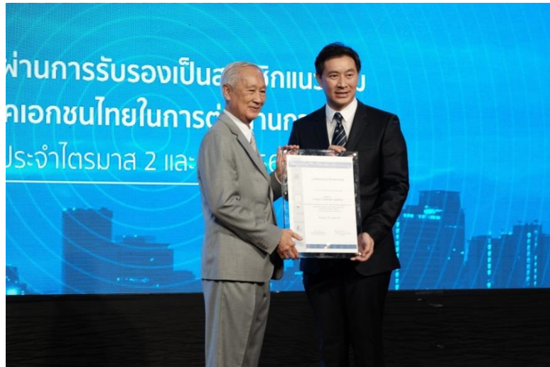
เมื่อวันที่ 18 สิงหาคม 2560 บริษัทฯ ได้รับการรับรองจากแนวร่วมปฏิบัติของภาคเอกชนไทย ในการต่อต้านทุจริต และได้รับมอบใบรับรองในวันที่ 21 พฤศจิกายน 2560