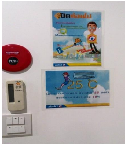
ป้ายรณรงค์การประหยัดไฟฟ้า

ตั้งแต่ปี 2547 บริษัทฯ และบริษัทย่อยได้จัดให้มีโครงการรณรงค์อนุรักษ์พลังงานและสิ่งแวดล้อม โดยให้พนักงานมีส่วนร่วมในการกำหนดมาตรการการประหยัดพลังงานด้วยวิธีต่างๆ เช่น การปิดไฟและเครื่องปรับอากาศในช่วงเวลาพักกลางวัน และก่อนเวลาเลิกงานครึ่งชั่วโมงของทุกวันทำการ การประหยัดการใช้กระดาษในทุกรูปแบบ ผลของโครงการนี้ ได้ช่วยทำให้พนักงานเข้าใจบทบาท และมีส่วนร่วมอย่างภาคภูมิใจในการใช้พลังงานอย่างประหยัด เพื่อช่วยลดสถานะโลกร้อน ทั้งยังสามารถลดค่าใช้จ่ายในส่วนของการใช้พลังงานและทรัพยากรได้อย่างเป็นรูปธรรมอีกด้วย