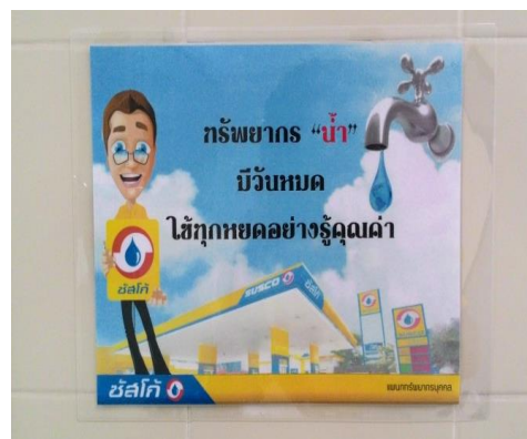
ป้ายรณรงค์การประหยัดน้ำ (ติดอยู่ภายในห้องน้ำของบริษัทฯ)