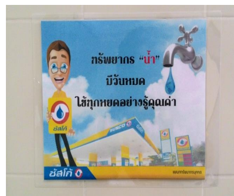
ป้ายรณรงค์การประหยัดน้ำ (ติดอยู่ภายในห้องน้ำของบริษัทฯ)

นอกจากนี้ บริษัทฯ ได้ติดตั้งระบบแผงโซลาร์เซลล์ที่อาคารสำนักงานใหญ่และบนหลังคาสถานีบริการน้ำมันของบริษัทฯ ปัจจุบันรวม 5 แห่ง ได้แก่ สาขาวิภาวดี1 สาขาบางปะกอก สาขาบางคูวัด สาขาเลียบคลองช่องนนทรี และ สาขาสวนหลวง ร.9 มีกำลังการผลิตกระแสไฟฟ้าสถานีละประมาณ 199.67 กิโลวัตต์ต่อชั่วโมง เพื่อใช้ผลิตกระแสไฟฟ้าจากพลังงานแสงอาทิตย์ อันเป็นการส่งเสริมการใช้พลังงานทดแทนตามแนวนโยบายของภาครัฐ และมีแผนงานที่จะขยายการติดตั้งแผงโซลาร์เซลล์บนหลังคาสถานีบริการน้ำมันเพิ่มขึ้นในอนาคต