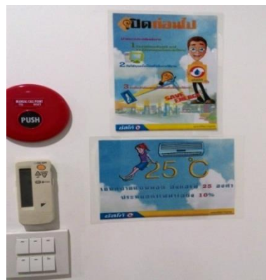
ป้ายรณรงค์การประหยัดไฟฟ้า

โดยให้พนักงานมีส่วนร่วมในการกำหนดมาตรการการประหยัดพลังงานด้วยวิธีต่างๆ เช่น การปิดไฟและเครื่องปรับอากาศในช่วงเวลาพักกลางวัน และก่อนเวลาเลิกงานครึ่งชั่วโมงของทุกวันทำการ การประหยัดการใช้กระดาษในทุกรูปแบบ ผลของโครงการนี้ ได้ช่วยทำให้พนักงานเข้าใจบทบาท และมีส่วนร่วมอย่างภาคภูมิใจในการใช้พลังงานอย่างประหยัด เพื่อช่วยลดสถานะโลกร้อน ทั้งยังสามารถลดค่าใช้จ่ายในส่วนของการใช้พลังงานและทรัพยากรได้อย่างเป็นรูปธรรมอีกด้วย