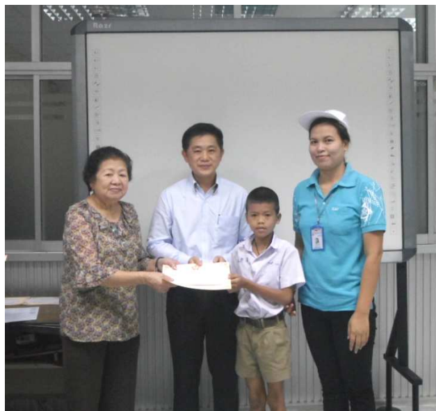
ภาพการมอบทุนการศึกษาที่ บมจ.ชัยวัฒนา แทนเนอรี่ กรุ๊ป (สาขา ก.ม. 30)

บริษัท ชัยวัฒนาฯ มีความเชื่อมั่นว่า การพัฒนาคุณภาพของเยาวชนเพื่อเป็นกำลังสำคัญในอนาคตเป็นสิ่งจำเป็นอย่างยิ่งสำหรับทุกประเทศ ด้วยเหตุนี้ บริษัทฯ จึงสนับสนุนและส่งเสริมพัฒนาการ การศึกษาของเยาวชนและชุมชน เพื่อช่วยยกระดับมาตรฐานการศึกษาของไทย โดยจัดโครงการมอบทุนการศึกษาให้กับบุตรของพนักงานในบริษัทฯ ที่มีผลการเรียนและความประพฤติดี