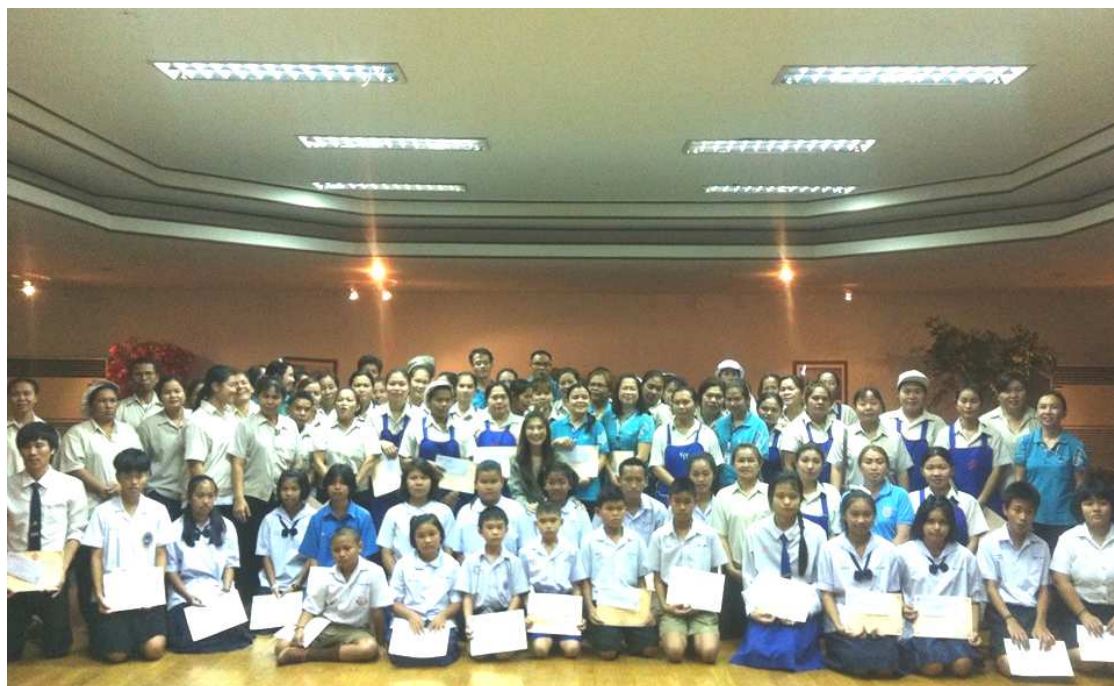
ภาพการมอบทุนการศึกษาที่ บมจ.ชัยวัฒนา แทนเนอรี่ กรุ๊ป (สาขา แพรกษา)