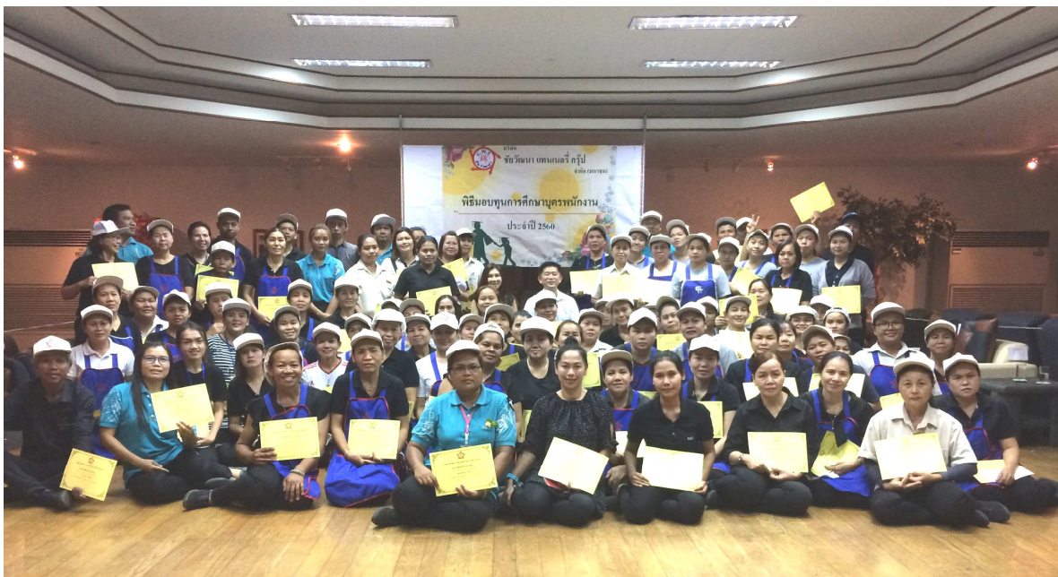
ภาพการมอบทุนการศึกษาที่ บมจ.ชัยวัฒนา แทนเนอรี่ กรุ๊ป (สาขา แพรกษา)