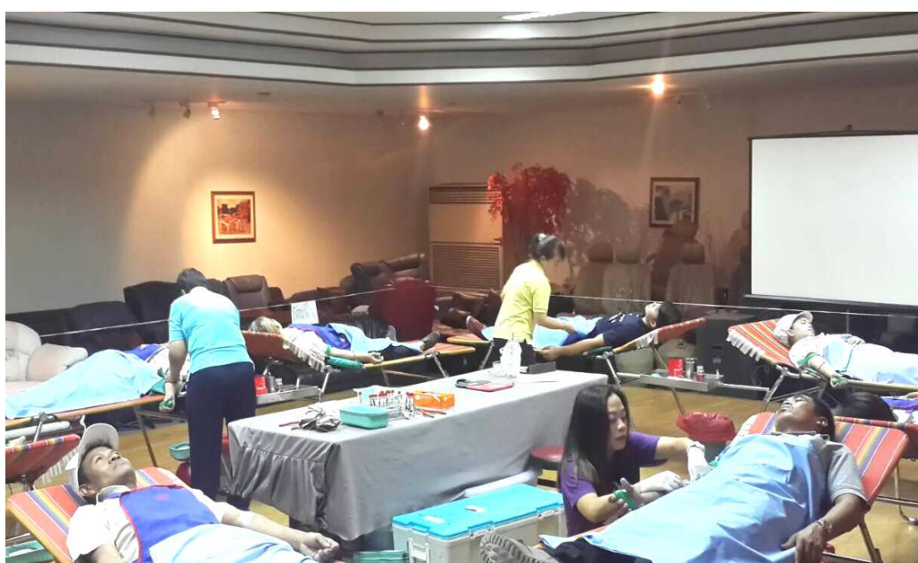
พนักงานร่วมบริจาคโลหิต