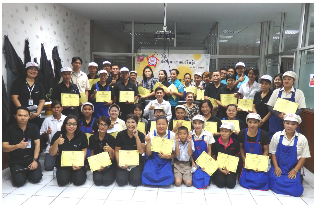
ภาพการมอบทุนการศึกษาที่ บมจ.ชัยวัฒนา แทนเนอรี่ กรุ๊ป (สาขา ก.ม. 30)