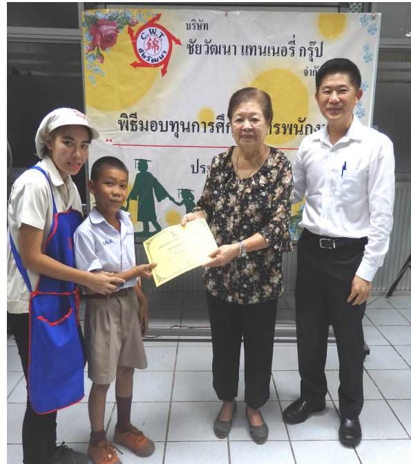
ผู้บริหารมอบทุนการศึกษาให้กับบุตรของพนักงาน