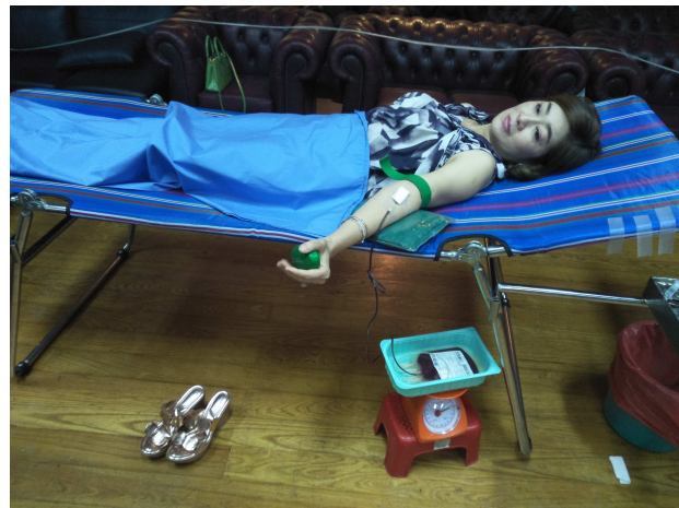
ผู้บริหารร่วมบริจาคโลหิต