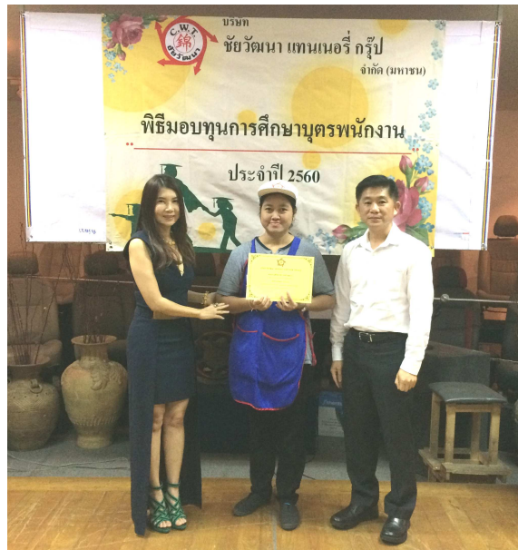
ผู้บริหารมอบทุนการศึกษาให้กับบุตรของพนักงาน