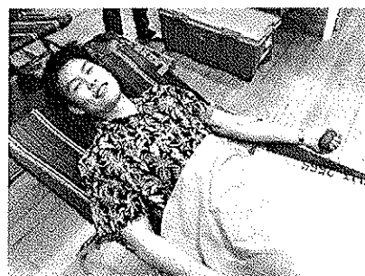
ผู้จัดการและพนักงานร่วมบริจาคโลหิต