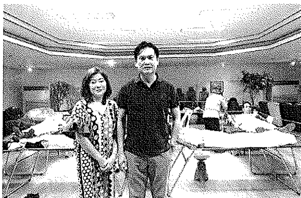
ผู้บริหารและครอบครัวร่วมบริจาคโลหิต

- การร่วมบริจาคโลหิตกับสภากาชาดไทย เพื่อนำไปให้กับผู้ป่วยที่ต้องการ โดยร่วมมือกับทางโรงพยาบาลสมุทรปราการ จัดให้มีการบริจาคโลหิตที่บริษัทฯ ทุก ๆ 3 เดือน ปีละ 4 ครั้ง โดยมีผู้บริหาร, ผู้จัดการ และ พนักงานร่วมทำกิจกรรม