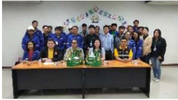
ตรวจสอบสภาพติดตั้งงานโรงไฟฟ้า GP2 และ APCON โดย หน่วยงาน สาธารณสุขในโครงการโรงงานสีขาว