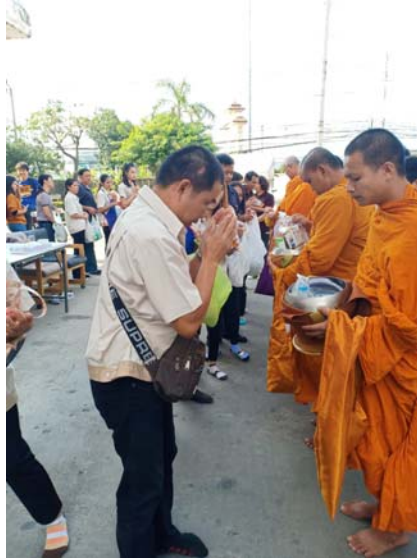
ผู้บริหาร ผู้จัดการและพนักงานร่วมทำบุญตักบาตร