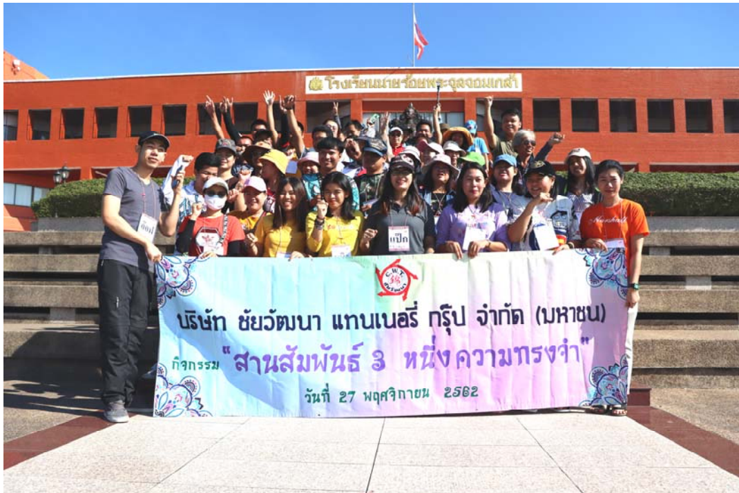
กิจกรรมสานสัมพันธ์ 3 หนึ่งความทรงจำ