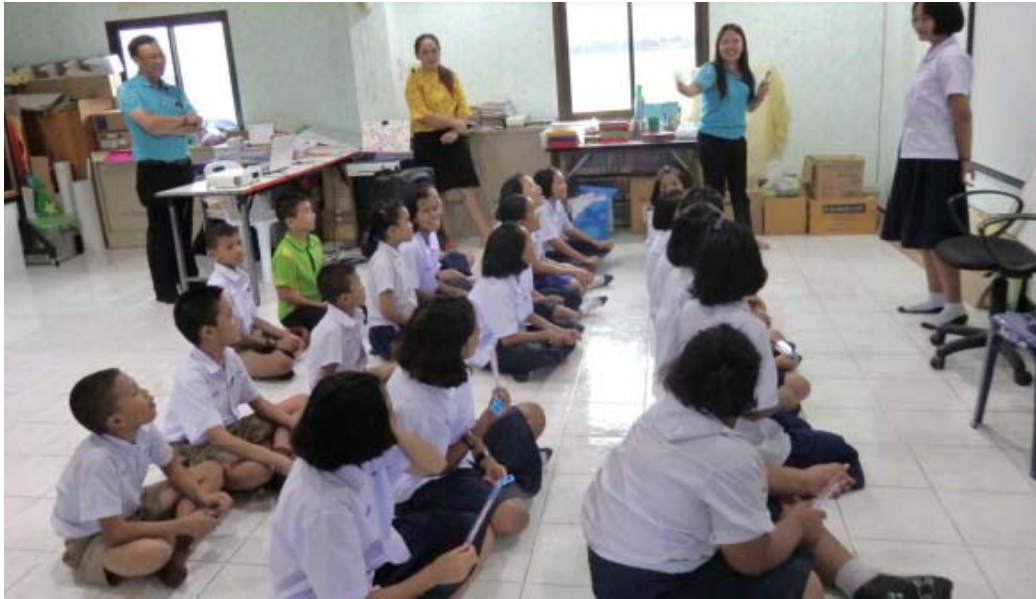
โครงการให้ความรู้พัฒนาทักษะภาษาอังกฤษ ให้กับนักเรียนชั้นประถมศึกษาปีที่ 5-6 โรงเรียนวัดราษฎร์โพธิ์ทอง