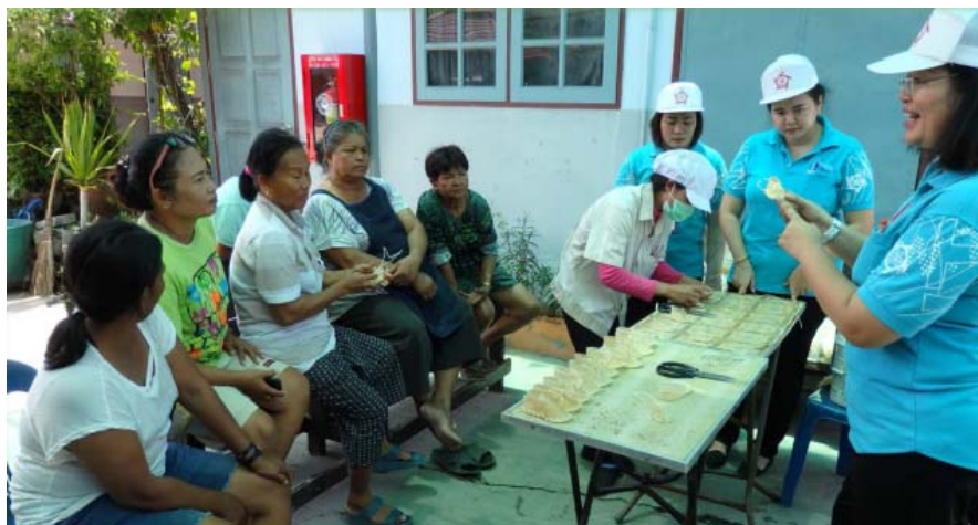
สร้างรายได้ให้กับชาวบ้านในชุมชนสุนทรนิมิต โดยนำสินค้าจากโรงงานให้ชุมชนรับจ้างผลิต