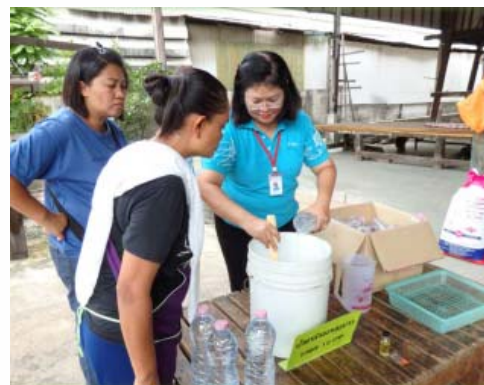
ให้ความรู้กับชุมชนรอบโรงงานถึงวิธีทำน้ำยาล้างจานและ วิธีทำน้ำหมักชีวภาพ