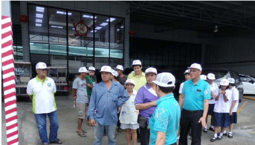
เชิญชุมชนรอบโรงงานเข้าเยี่ยมชมขบวนการผลิตในโรงฟอกหนัง