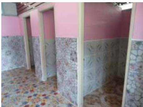
ร่วมสนับสนุนค่าใช้จ่ายในการสร้างห้องน้ำโรงเรียน บ้านหนองไทร