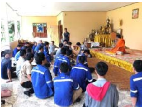
ถวายเทียนพรรษา ณ โรงเรียนวัดหนองไทรราษฎร์บำรุง