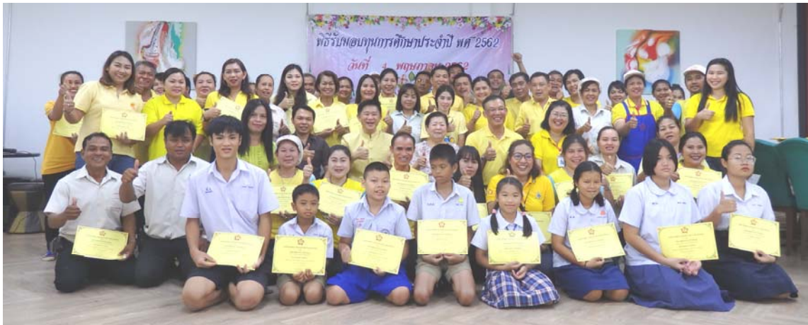
ภาพการมอบทุนการศึกษาที่ บมจ.ชัยวัฒนา แทนเนอรี่ กรุ๊ป (สาขา ก.ม. 30)