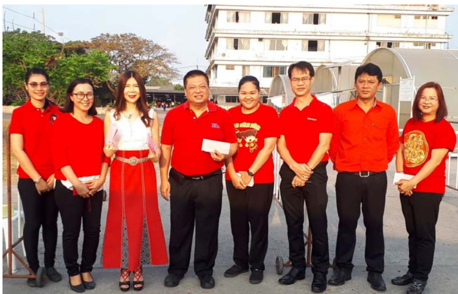
กิจกรรมวันตรุษจีน