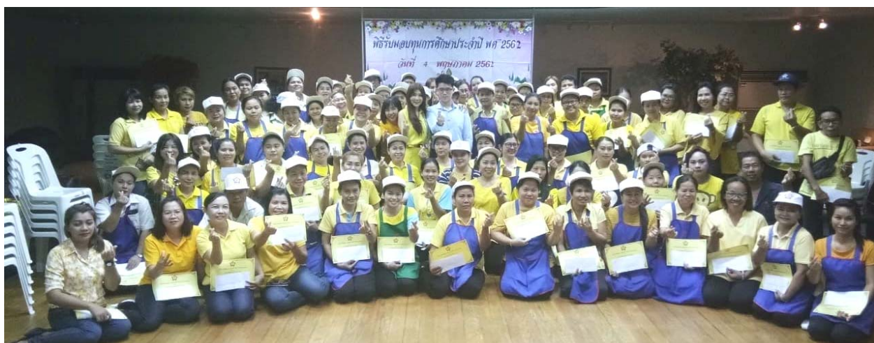
ภาพการมอบทุนการศึกษาที่ บมจ.ชัยวัฒนา แทนเนอรี่ กรุ๊ป (สาขา แพรกษา)