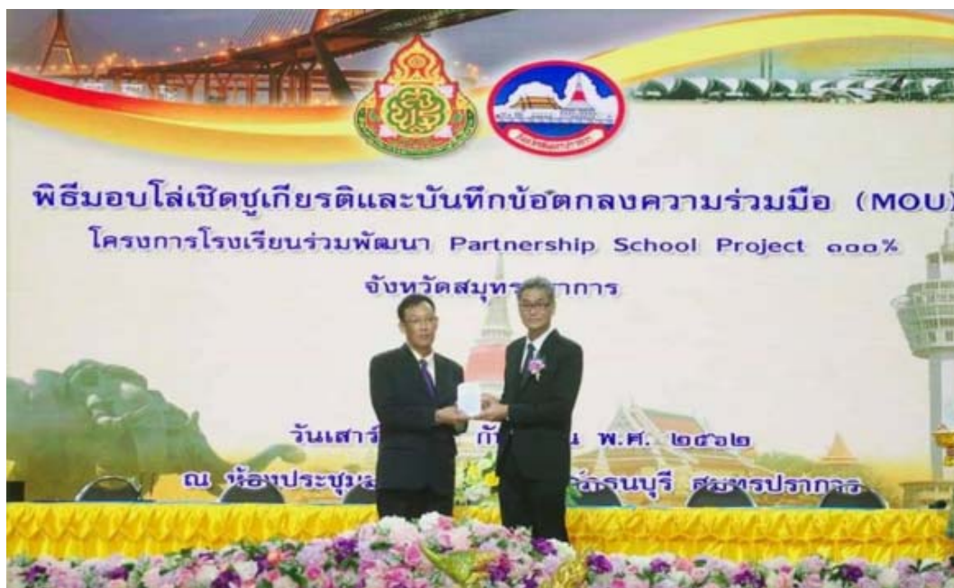
ผู้บริหารรับมอบโล่เชิดชูเกียรติและบันทึกข้อตกลงความร่วมมือโครงการโรงเรียนร่วมพัฒนา เมื่อ 28 กันยายน 2562