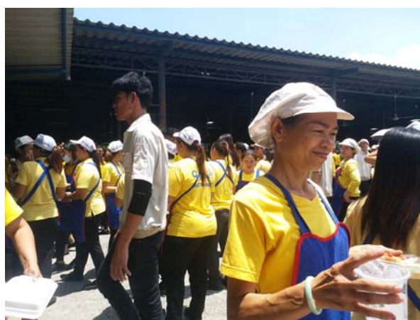
กิจกรรมทำบุญโรงงาน