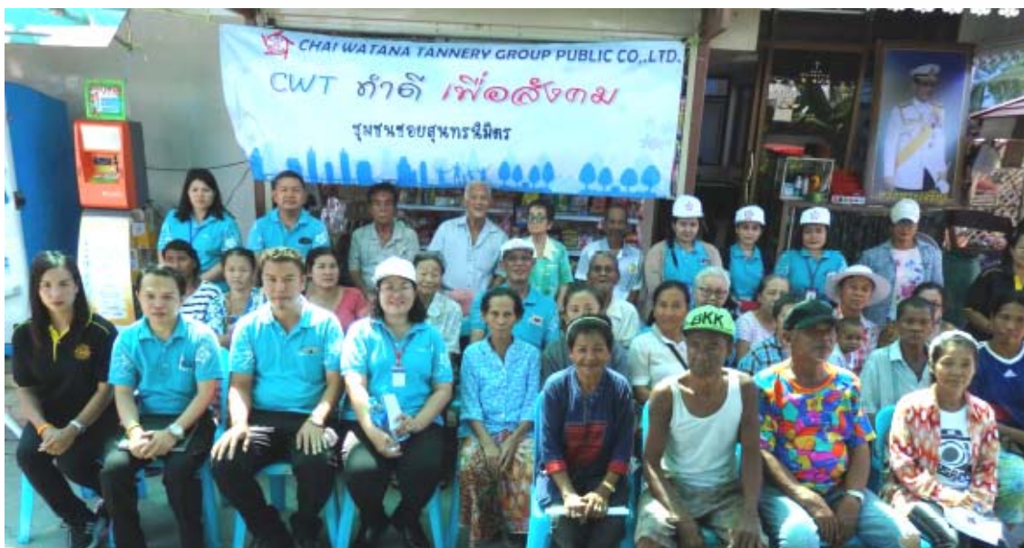
คณะผู้บริหารและพนักงานพบปะชุมชนชอยสุนทรนิมิตร