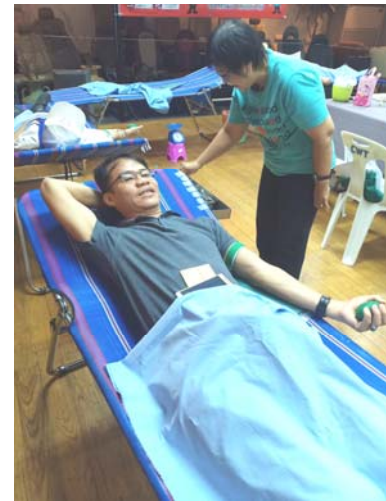
ผู้บริหาร ผู้จัดการและพนักงานร่วมบริจาคโลหิต