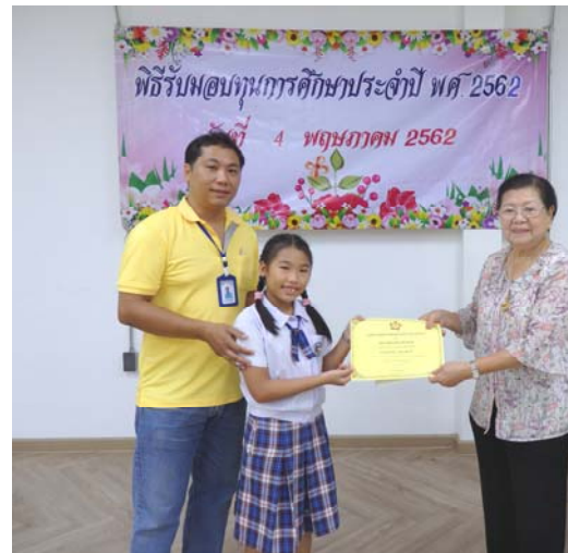
ผู้บริหารมอบทุนการศึกษาให้กับบุตรของพนักงาน