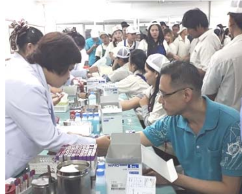
ผู้บริหารและพนักงานเข้ารับการตรวจสอบสุขภาพประจำปีกับโรงพยาบาลเมืองสมุทรปราการ

- การให้ทุนการศึกษา : บริษัทฯ มีความเชื่อมั่นว่าการพัฒนาคุณภาพของเยาวชนเพื่อเป็นกำลังสำคัญในอนาคตเป็นสิ่งจำเป็นอย่างยิ่งสำหรับทุกประเทศ ด้วยเหตุนี้ บริษัทฯ จึงสนับสนุนและส่งเสริมพัฒนาการศึกษาของเยาวชน เพื่อช่วยยกระดับมาตรฐานการศึกษาของไทย โดยจัดโครงการมอบทุนการศึกษาให้กับบุตรของพนักงานในบริษัทฯ ที่มีผลการเรียนและความประพฤติดี