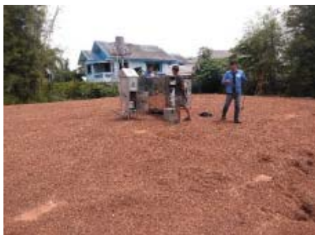
ติดตั้งเครื่องตรวจวัดเสียง ลม อากาศ เพื่อติดตาม ผลกระทบสิ่งแวดล้อมจากโรงไฟฟ้าในพื้นที่ชุมชน