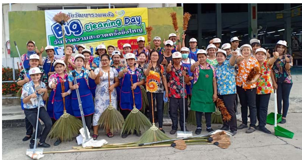
กิจกรรมวันสงกรานต์