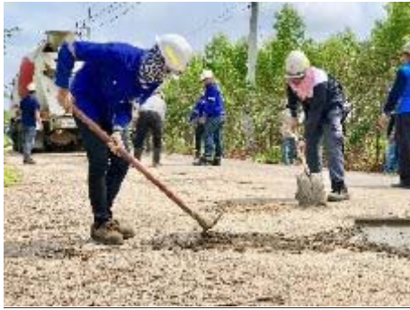
ปรับปรุงถนนทางเข้าหนองไทร