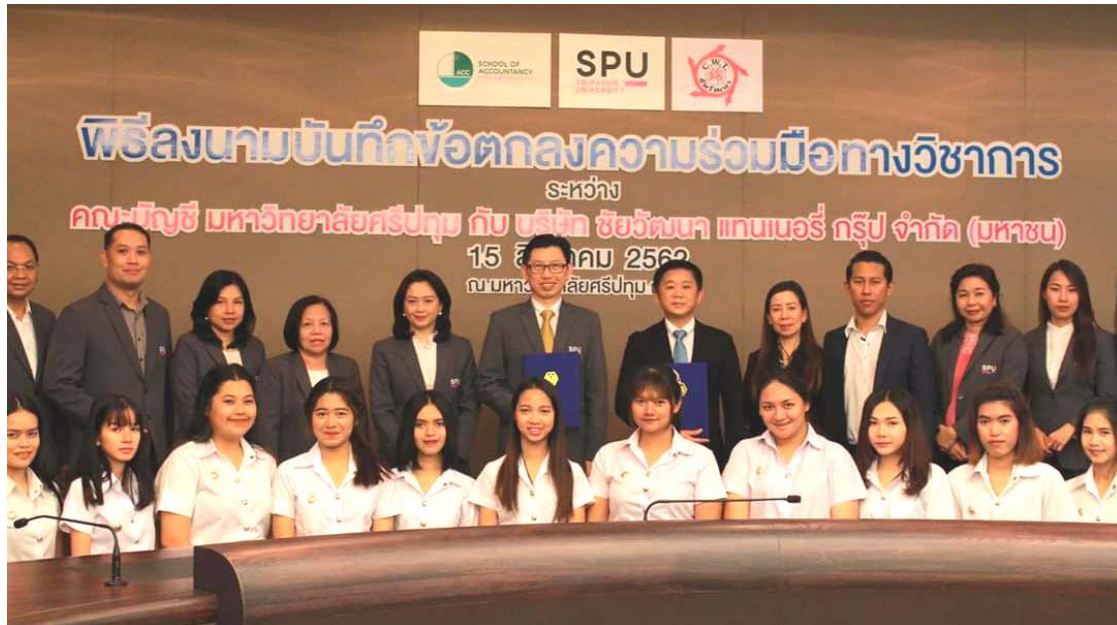
ผู้บริหารร่วมลงนามบันทึกข้อตกลงความร่วมมือทางวิชาการกับมหาวิทยาลัยศรีปทุม เมื่อ 15 สิงหาคม 2562

ด้านการศึกษา: บริษัทฯ ตระหนักดีว่าเด็กและเยาวชนคือรากฐานสำคัญในการสร้างความเจริญก้าวหน้าให้กับประเทศ บริษัทฯ จึงได้ดำเนินโครงการพัฒนาเยาวชนและส่งเสริมการศึกษาที่หลากหลายตลอดปี 2562 ดังนี้