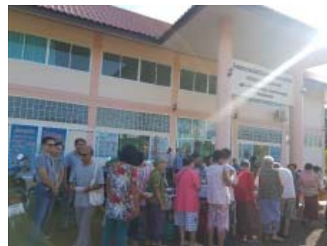
สนับสนุนอาหารเช้าแก่ผู้เข้ารับการตรวจโรคเรื้อรัง ณ อณามัยหนองไทร