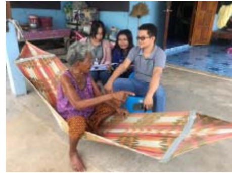
สำรวจความคิดเห็นด้านผลกระทบสิ่งแวดล้อมจากโรงไฟฟ้าในพื้นที่ชุมชน