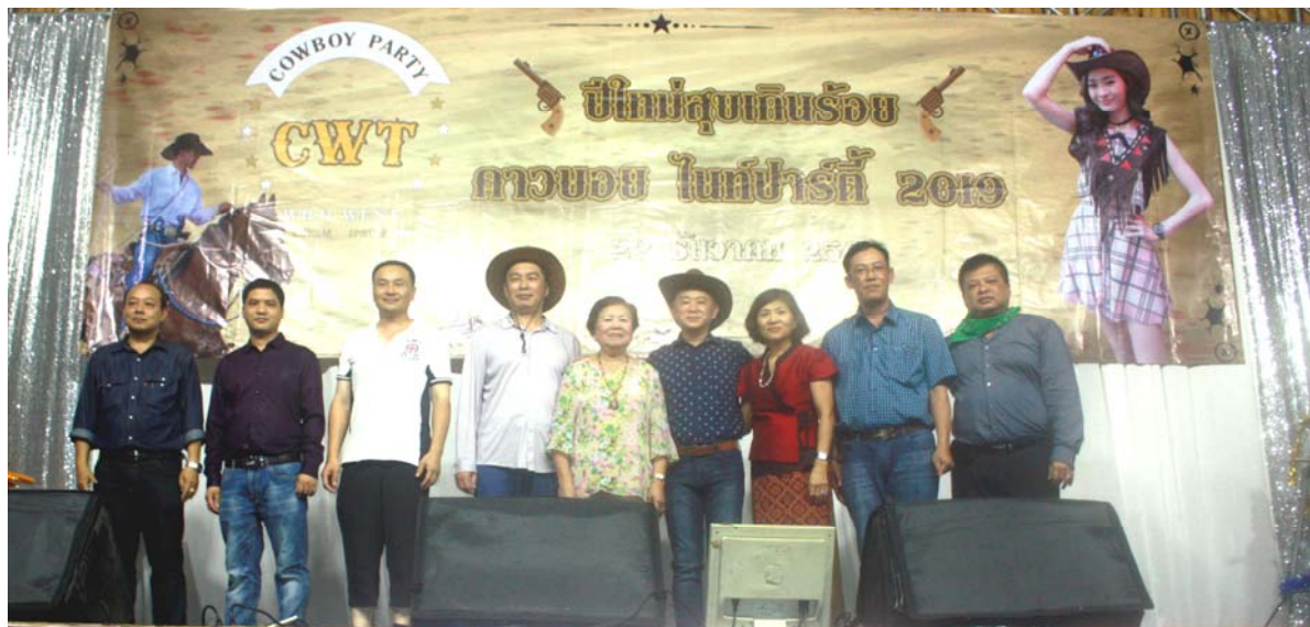
กิจกรรมเลี้ยงสังสรรค์วันส่งท้ายปีเก่าต้อนรับปีใหม่