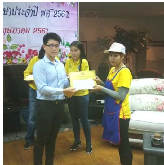
ผู้บริหารมอบทุนการศึกษาให้กับบุตรของพนักงาน