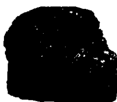
บิทูมินัส