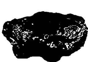
แอนทราไซต์