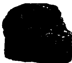
บิทูมินัส