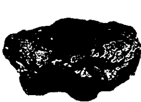
แอนทราไซต์