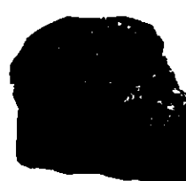
ซับบิทูมินัส