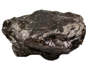
แอนทราไซต์