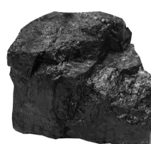
ซับบิทูมินัส