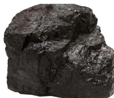
บิทูมินัส