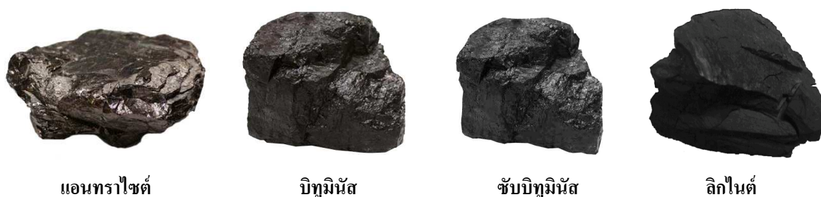
แอนทราไซต์