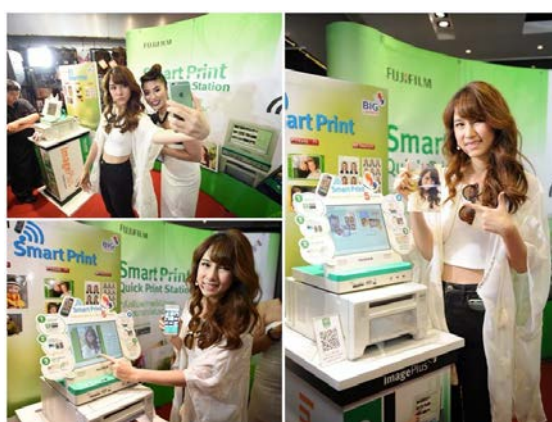
ภาพแสดงเครื่องพิมพ์ภาพ Fuji Digital Image

ดำเนินงานภายใต้ชื่อ “Image Plus by BIG Camera” ซึ่งเป็นการให้บริการพิมพ์ภาพถ่ายคุณภาพสูง รวมถึงการสร้างสรรค์งานพิมพ์ภาพถ่ายในรูปแบบพิเศษภายใต้ระบบการพิมพ์แบบดิจิทัลซึ่งสามารถให้ผลผลิตงานภาพถ่ายได้ดีเทียบเท่ากับงานในระดับมืออาชีพ โดย บิ๊ก คาเมร่า มีให้เลือกสรรหลากหลายรูปแบบ ทั้งการพิมพ์ภาพคุณภาพสูง การพิมพ์ภาพติดบัตร การจัดทำรูปเล่มสมุดภาพตามสไตล์ที่ไม่จำกัด (Photo book) นอกจากนั้นบริษัทฯ ยังได้ร่วมมือทางการตลาดกับ บริษัท ฟุจิฟิล์ม ประเทศไทย จำกัด ติดตั้งศูนย์แลปดิจิทัล FDI Station (Fuji Digital Image Station) ในร้าน BIG Camera ที่ครอบคลุมทั่วประเทศ ภายใต้แนวคิด “BIG Printing Solution” เพื่อตอบสนองความต้องการของผู้บริโภคที่ต้องการเก็บภาพประทับใจ ภาพสำคัญในงานพิธีต่างๆ โดยลูกค้าผู้ใช้บริการสามารถสั่งพิมพ์งานได้จากสื่อบันทึกดิจิทัลทุกชนิด สามารถพิมพ์งานที่บันทึกได้จากโทรศัพท์เคลื่อนที่ ผ่านระบบ Wireless ไม่ว่าจะเป็น WiFi - Bluetooth หรือการเลือกพิมพ์ภาพจาก Social Media