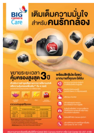
ภาพแสดง บริการขยายระยะเวลาการรับประกันอุปกรณ์ถ่ายภาพ

การให้บริการขยายระยะเวลาการรับประกันอุปกรณ์ถ่ายภาพดำเนินงานภายใต้ชื่อ “BIG Camera Care” ซึ่งผู้บริหารได้เล็งเห็นถึงการบริการหลังการขายอันเป็นสิ่งจำเป็นสำหรับลูกค้าที่ซื้ออุปกรณ์ถ่ายภาพ ภายใต้แนวคิด “ทุกปัญหากลายเป็นเรื่องเล็กได้ และพร้อมเติมเต็มความมั่นใจสำหรับคนรักกล้อง” เป็นบริการที่ บิ๊ก คาเมร่า ให้บริการเป็นปี 6 ซึ่งเป็นความร่วมมือกับ บริษัท สยามคอสโมส เซอร์วิส จำกัด โดยสามารถรองรับลูกค้าที่ซื้อกล้องถ่ายภาพในราคาสูงกว่า 5 พันบาทขึ้นไป การบริการชนิดนี้ให้ประโยชน์แก่ลูกค้าในการขยายระยะเวลาการรับประกันกล้องถ่ายรูปเพิ่มเติมจากการรับประกันมาตรฐาน (1 ปี) เป็นสูงสุด 3 ปี ภายใต้เงื่อนไขเดียวกันกับผู้ผลิต โดยไม่มีผลผูกพันกับบริษัทผู้ผลิตกล้องแต่อย่างใด นอกจากนี้ยังครอบคลุมถึงการคุ้มครองเพิ่มขึ้นอีก 4 กรณีคือ ไฟไหม้ ฟ้าผ่า ลักทรัพย์ (โดยมีร่องรอย) และไฟฟ้าลัดวงจร