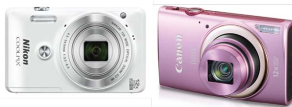
ตัวอย่างกล้องถ่ายภาพประเภทพกพา

เป็นกล้องถ่ายภาพที่มีขนาดเล็ก สะดวกในการพกพาและเป็นกล้องที่เหมาะสมกับนักถ่ายภาพที่เป็นมือใหม่ (Beginner Photographer) ไปจนถึงนักถ่ายภาพในระดับกลาง โดยคุณสมบัติสำหรับกล้องถ่ายภาพประเภทนี้คือ จะเหมาะกับกิจกรรมการถ่ายภาพที่ผู้ถ่ายไม่ต้องการขั้นตอนหรือวิธีการถ่ายภาพที่ซับซ้อนเหมือนกับกล้องถ่ายภาพประเภทอื่น อย่างไรก็ตาม กล้องถ่ายภาพประเภทนี้ค่อนข้างมีข้อจำกัดในเรื่องวัตถุประสงค์ของภาพถ่ายเนื่องจากเป็นกล้องที่ใช้ใช้ไม่สามารถเปลี่ยนเลนส์ได้ ดังนั้นเรื่องประเภทของผลผลิตภาพถ่ายจึงมีข้อจำกัด ปัจจุบันกล้องประเภทพกพายังคงได้รับความนิยมจากกลุ่มผู้บริโภคบางกลุ่มอยู่ เนื่องจากเป็นกลุ่มผลิตภัณฑ์ที่ราคาไม่สูงมากนัก ใช้งานง่าย พกพาสะดวก จึงยังคงเป็นที่ต้องการของตลาดในปัจจุบัน