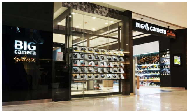
ภาพแสดง สาขา BIG Camera Galleria (Emquartier)