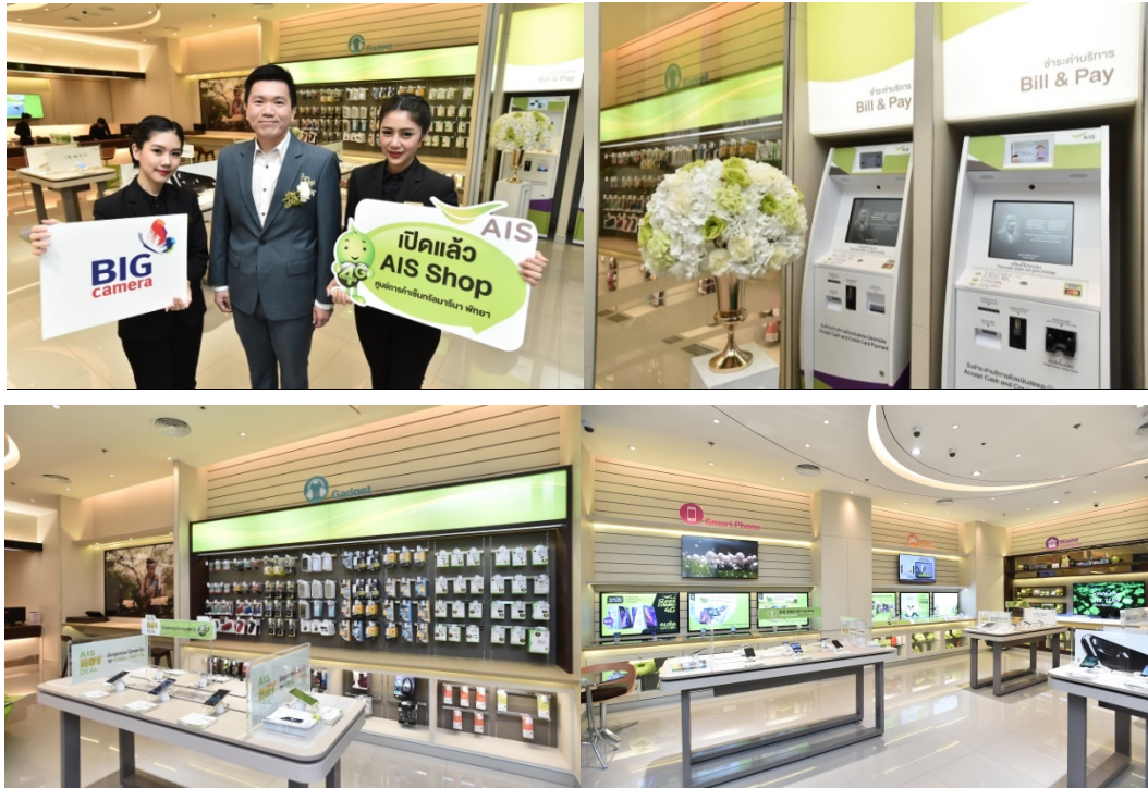
ภาพแสดง สาขา AIS Shop by Partner