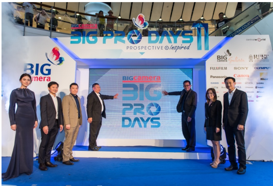
ภาพแสดงงาน BIG Pro Days ครั้งที่ 11