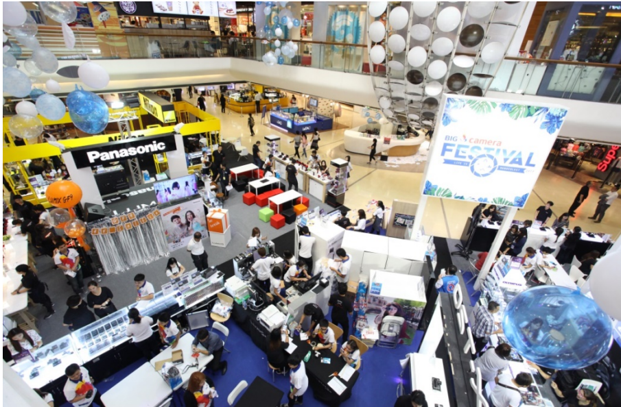
ภาพแสดงงาน Big Festival