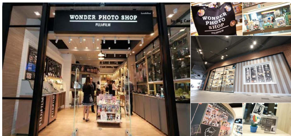
ภาพแสดง สาขา Wonder Photo Shop