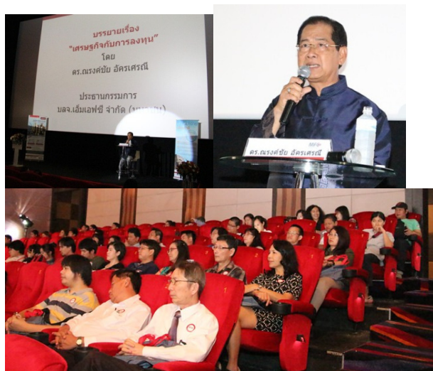
MFC Finance Forum ครั้งที่ 15

ในรอบปี 2557 บริษัทได้จัดให้มีกิจการเพื่อสนับสนุนกิจกรรมเพื่อสังคม ดังนี้