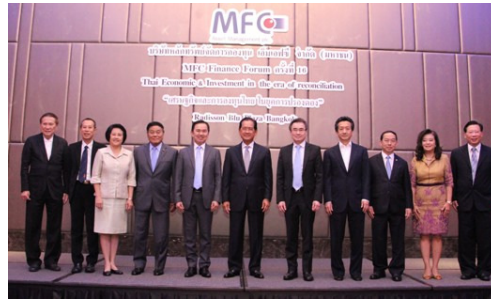
MFC Finance Forum ครั้งที่ 16