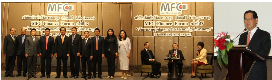
MFC Finance Forum

เอ็มเอฟซีจัดงานสัมมนา MFC Finance Forum ครั้งที่ 15 เรื่อง “เศรษฐกิจกับการลงทุน” ครั้งที่ 16 เรื่อง “เศรษฐกิจและการลงทุนไทย ในยุคการปรองดอง” และครั้งที่ 17 เรื่อง “นโยบายเศรษฐกิจในยุคการปรองดองและปฏิรูปการลงทุน” เพื่อให้ความรู้ความเข้าใจตลอดจนภาพรวมเศรษฐกิจและการลงทุนให้ผู้ถือหน่วยลงทุนและผู้สนใจทั่วไป