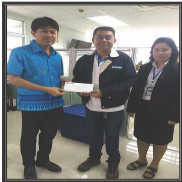
มอบทุนการศึกษาให้กับโรงเรียนแพรภษาวิเทศศึกษา

4. โครงการของบริษัทร่วม – เอสเอสยูที มีการดำเนินการร่วมกับชุมชนเพื่อสร้างความใกล้ชิด ความมั่นใจ และมีความสัมพันธ์ที่ดีต่อชุมชน โครงการต่าง ๆ ในปี 2562 อาทิเช่น