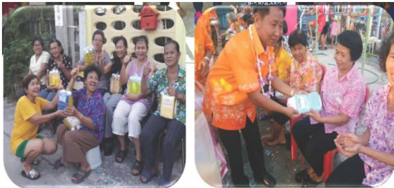
แจกของขวัญวันผู้สูงอายุ เทศกาลสงกรานต์

กิจกรรมเดิน-วิ่งเพื่อการกุศล “บางพลีมินิมาราธอน”