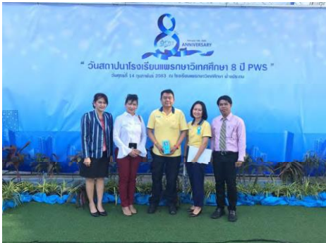
มอบทุนการศึกษาให้กับโรงเรียนแพรภชาวิทศึกษา

3. โครงการของบริษัทร่วม – เอสเอสยูที มีการดำเนินการร่วมกับชุมชนเพื่อสร้างความใกล้ชิด ความมั่นใจ และมีความสัมพันธ์ที่ดีต่อชุมชน ในโครงการต่าง ๆ อาทิเช่น