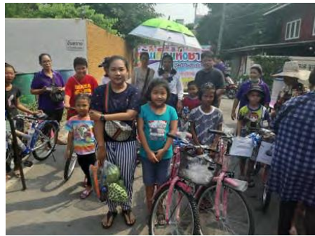
แจกของขวัญวันเด็กให้กับ ชุมชนรอบๆ โรงไฟฟ้า