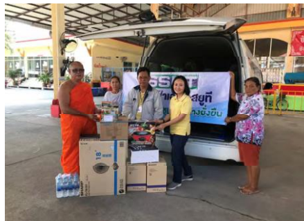
สนับสนุนของขวัญงานประจำปี วัดศรีจันทร์ประดิษฐ์

มอบข้าวสารอาหารแห้งและถุงยังชีพให้กับผู้ได้รับผลกระทบจากสถานการณ์โควิด-19