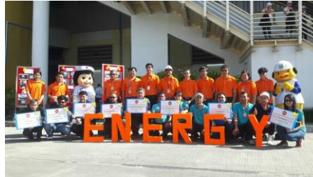
โครงการส่งเสริมการอนุรักษ์พลังงานภายในโรงงานประจำปี 2560