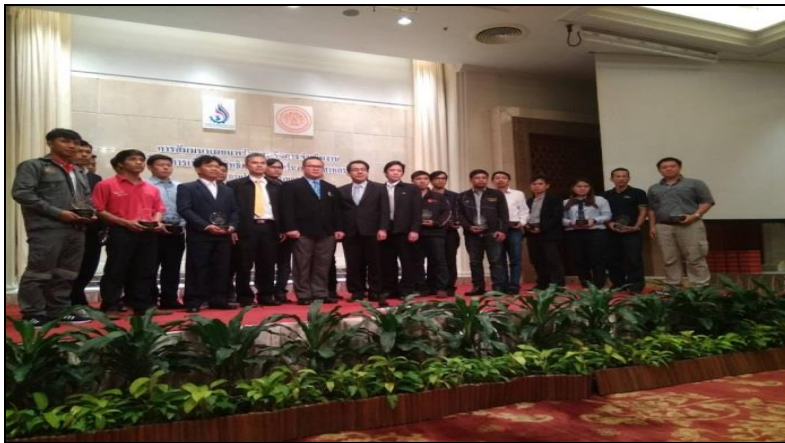
พิธีรับมอบโล่ เมื่อวันที่ 7 กันยายน 2561

นอกจากนี้ บริษัทฯ ยังได้รับรางวัลจากกรมพัฒนาพลังงานทดแทนและอนุรักษ์พลังงานกระทรวงพลังงานจากการเข้าร่วมโครงการเพิ่มประสิทธิภาพหม้อน้ำในภาคอุตสาหกรรมโดยเป็นโครงการส่งเสริมการดำเนินการมาตรการอนุรักษ์พลังงานด้วยกลไกการตรวจสอบและรับรองการจัดการพลังงานตามกฎหมาย ประจำปี งบประมาณ 2561 และเป็นโครงการสนับสนุนการปรับปรุงประสิทธิภาพการจัดการพลังงานในระบบอากาศอัดทั้งระบบด้วยระบบควบคุมอัตโนมัติ ตามนโยบาย Thailand 4.0 ปีงบประมาณ 2561