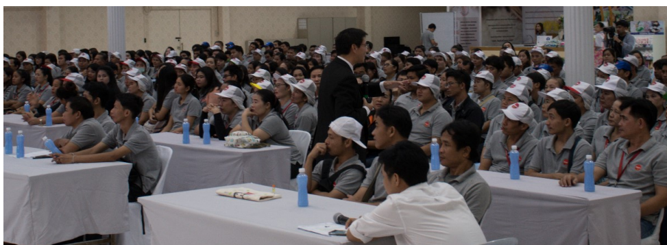
บรรยากาศการฝึกอบรมจริยธรรมกับมาตรการต่อต้านทุจริตคอร์รัปชันแก่พนักงานและผู้บริหารบริหาร

งานขยายแนวร่วมสู่คู่ค้าประกาศเจตนารมณ์ตามนโยบายต่อต้านการทุจริตคอร์รัปชันของ Malee Group ที่โรงแรมโนโวเทล กรุงเทพมหานคร 20 วันที่ 24 กันยายน 2020