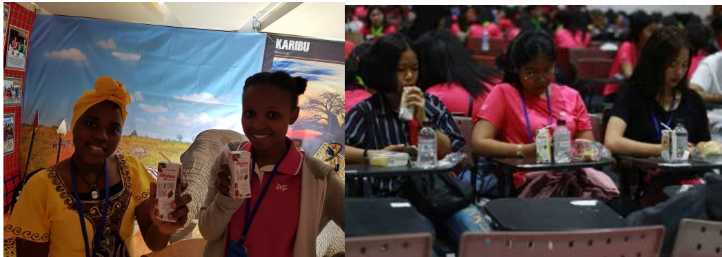
มูนีชีเยาวชนสัมพันธ์นานาชาติ

ช่วงสถานการณ์ COVID-19 มาลีได้ร่วมบริจาคผลิตภัณฑ์มาลีแกมมูนีชี Scholars of Sustenance (SOS) และ มูนีชีสตี้ (SATI) เพื่อส่งต่อมอบการช่วยเหลือกลุ่มเด็กในพื้นที่เสี่ยงและเด็กด้อยโอกาสให้เข้าถึงการศึกษาและสุขภาพอนามัยที่เหมาะสม จึงเกิด การจัดตั้งกลุ่ม COVID RELIEF โดยการนำผลิตภัณฑ์มาลีไปแจกจ่ายกลุ่มผู้เดือดร้อนจากสถานการณ์ COVID-19 ผ่านอาสาสมัครของแต่ละชุมชน