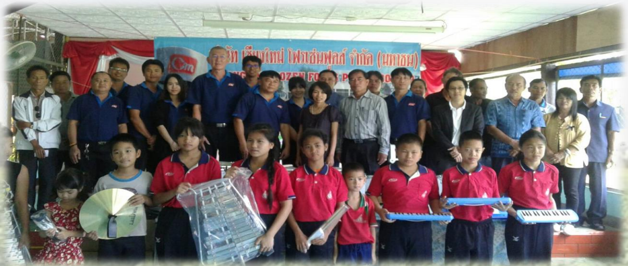
โรงเรียนบ้านสันกลาง ต.ป่าไผ่ อ.พร้าว เชียงใหม่

เพื่อเป็นการตอบแทนสังคมและสนับสนุนการศึกษาให้กับเด็ก เยาวชน ที่จะเติบโตขึ้นมาเป็นผู้ใหญ่ ช่วยพัฒนาสังคม ประเทศชาติ บริษัทฯ ได้ร่วมสนับสนุนอุปกรณ์กีฬาและอุปกรณ์ดนตรี เพื่อการศึกษาให้กับโรงเรียน โดยในปีนี้ได้มอบให้ 2 โรงเรียน คือ โรงเรียนบ้านสันกลาง ตำบลป่าไผ่ อำเภอพร้าว จังหวัดเชียงใหม่ เมื่อวันที่ 23 ตุลาคม และโรงเรียนบ้านปงถ้ำ ตำบลวังทอง อำเภอวังเหนือ จังหวัดลำปาง เมื่อวันที่ 17 ตุลาคม