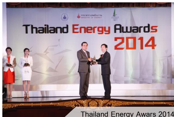
Thailand Energy Awards 2014