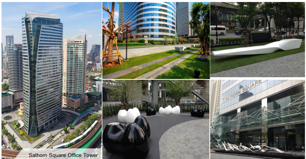
Sathorn Square Office Tower

บริษัทฯ ตระหนักถึงความสำคัญในการพัฒนาศักยภาพพนักงาน ไปพร้อมๆ กับการเติบโตในธุรกิจของบริษัทฯ อันเป็นการแสดงถึงความรับผิดชอบต่อสังคมและนำไปสู่การพัฒนาที่ยั่งยืน โดยมีการสนับสนุนและส่งเสริมให้มีการฝึกอบรม แลกเปลี่ยนความรู้ พัฒนาความรู้ความสามารถของพนักงานอย่างทั่วถึง เพื่อสร้างความมั่นคงและความเติบโตในสายงาน โดยให้โอกาสพนักงานในการพัฒนาศักยภาพเพื่อให้เกิดความเชี่ยวชาญ มีการพัฒนาความรู้ความสามารถของพนักงานอย่างต่อเนื่อง มีการส่งเสริมให้พนักงานมีส่วนร่วมในการกำหนดทิศทางการดำเนินงาน และการพัฒนาบริษัทฯ การทำงานของพนักงานถูกกำหนดให้อยู่ในสภาพแวดล้อมที่ไม่เป็นอันตรายต่อสุขภาพร่างกาย โดยบริษัทฯ เป็นผู้จัดหาสิ่งอำนวยความสะดวกที่จำเป็นในการปฏิบัติหน้าที่ รวมทั้งจัดสภาพแวดล้อมการทำงานโดยคำนึงถึงหลักความปลอดภัย อาชีวอนามัยและสิ่งแวดล้อม ให้มีความปลอดภัยต่อชีวิตและทรัพย์สินของพนักงาน อีกทั้งยังเอื้อประโยชน์ในการทำงานอย่างสูงสุด