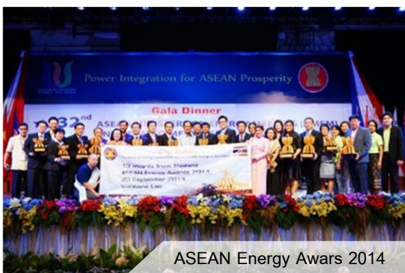
ASEAN Energy Awards 2014