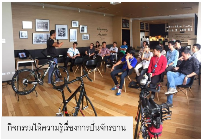
กิจกรรมให้ความรู้เรื่องการปั่นจักรยาน