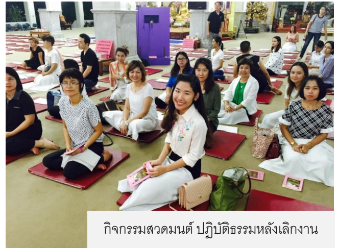
กิจกรรมสวดมนต์ ปฏิบัติธรรมหลังเลิกงาน