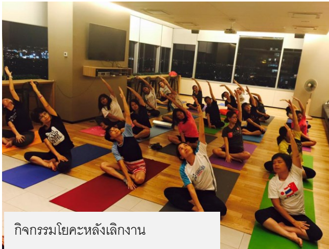
กิจกรรมโยคะหลังเลิกงาน