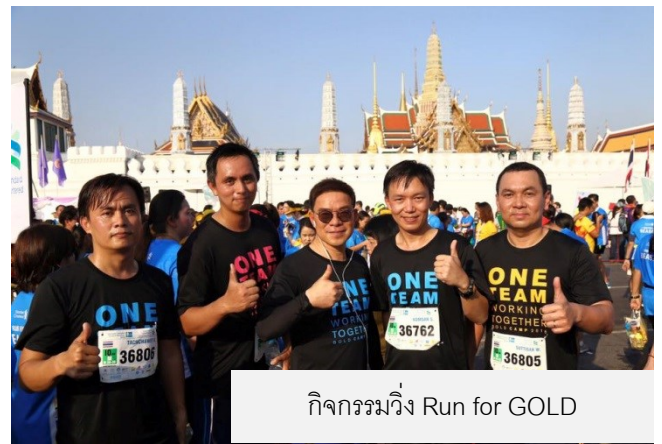
กิจกรรมวิ่ง Run for GOLD

นอกเหนือจากการดูแลพนักงานในบริษัทฯ แล้ว บริษัทฯ ยังให้ความสำคัญกับคุณภาพชีวิตแรงงานของคู่ค้าที่ดำเนินธุรกิจร่วมกัน เช่น บริษัทรับเหมาก่อสร้าง โดยบริษัทฯ ได้จัดหาบริเวณสำหรับการสร้างบ้านพักคนงานที่ใกล้กับสถานที่ก่อสร้าง เพื่อสะดวกในการเดินทางและลดปัญหาการจราจรจากการขนส่งแรงงาน และมีการสำรวจสภาพความเป็นอยู่ของแรงงานในที่พักคนงานเป็นประจำ เพื่อให้การปรับปรุงแก้ไขร่วมกับคู่ค้าในกรณีที่มีปัญหา