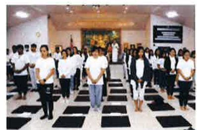
การปฏิบัติธรรม