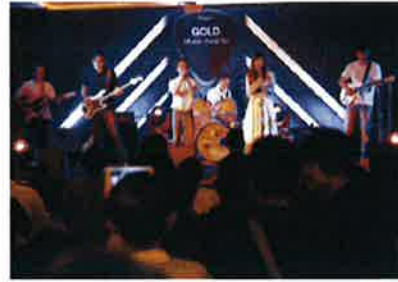
การจัดประกวดวงดนตรีภายในบริษัท

สำหรับการดูแลคุณภาพชีวิตแรงงานของคู่ค้าที่ดำเนินธุรกิจร่วมกัน เช่น บริษัทรับเหมาก่อสร้าง บริษัทฯ ได้มีการสำรวจสภาพความเป็นอยู่สภาพการทำงานของแรงงานเป็นประจำ เพื่อให้การปรับปรุงแก้ไขร่วมกับคู่ค้าในกรณีที่พบปัญหา นอกจากนี้ยังมีการมอบของอุปโภคบริโภคแก่แรงงานในโอกาสต่างๆ อีกด้วย