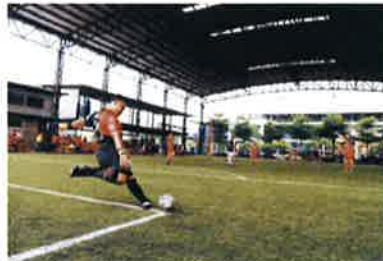
การแข่งขันฟุตบอลภายในบริษัทฯ