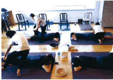
นวดผ่อนคลายความเมื่อยล้าจากการทำงาน