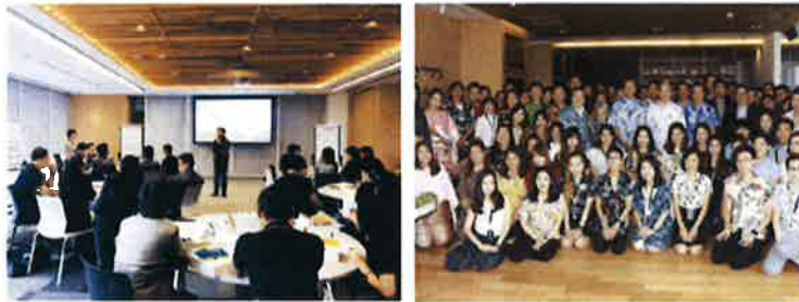
กิจกรรมรณรงค์วันสงกรานต์ ที่ได้สร้างความผูกพันระหว่าง คณะกรรมการบริษัทและพนักงานบริษัทฯ

บริษัทฯ ได้รณรงค์ปลูกจิตสำนึกให้พนักงานในบริษัทฯ ให้ยึดถือ และปฏิบัติตามหลักสิทธิมนุษยชนสากล และส่งเสริมให้พนักงานได้ดำเนินชีวิตส่วนตัว และชีวิตการทำงานอย่างมีสมดุล มีการจัดตั้งหน่วยงานชื่อว่า Happy Helper เพื่อส่งเสริมการทำกิจกรรมร่วมกันในองค์กร การมีส่วนร่วมในการทำประโยชน์ต่อสังคม โดยมีการจัดกิจกรรมอย่างต่อเนื่อง อาทิ การจัดกิจกรรมเดินแอโรบิก กิจกรรมโยคะในสำนักงาน การจัดประกวดวงดนตรี และการแข่งขันกีฬาภายในบริษัท แบดมินตัน ฟุตบอล การจัดกิจกรรมเพื่อสุขภาพ การนวดผ่อนคลายความเมื่อยล้าจากการทำงาน การปฏิบัติธรรม ทั้งนี้เพื่อเป็นการส่งเสริมบุคลากรในการพัฒนาตนเองทั้งทางสุขภาพกายและสุขภาพใจ