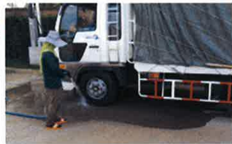
ทำความสะอาดบริเวณก่อนออกจากโครงการ เพื่อควบคุมไม่ให้ฝุ่นละอองฟุ้งไปนอกพื้นที่ก่อสร้าง

สำหรับการพัฒนาโครงการที่อยู่อาศัย บริษัทฯ ตระหนักดีว่ากระบวนการดำเนินงานในการพัฒนาโครงการนั้นมีผลกระทบต่อภายนอกหลายมิติด้วยกัน บริษัทฯ จึงได้ให้ความสำคัญกับการรับทราบปัญหาและสร้างความสัมพันธ์อันดีกับชุมชนโดยรอบบริเวณโครงการ โดยมีการจัดตั้งหน่วยงานที่คอยให้ข้อมูล สร้างความเข้าใจ รับฟังปัญหาจากผู้อยู่อาศัยโดยรอบเพื่อนำมาวิเคราะห์ และหาแนวทางแก้ไขร่วมกัน