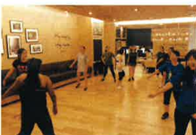
แอโรบิกในสำนักงาน