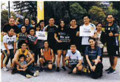
โกลด์แลนด์ วิ่งเพื่อเพื่อน