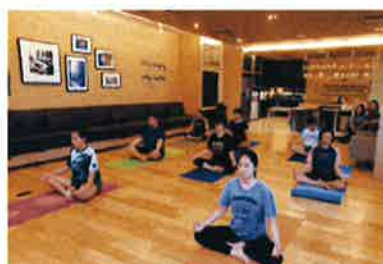
โยคะในสำนักงาน