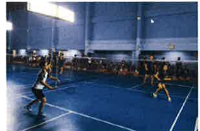
การแข่งขันแบดมินตันภายในบริษัทฯ