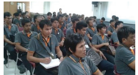
การจัดอบรมเกี่ยวกับการอนุรักษ์พลังงานให้กับพนักงาน