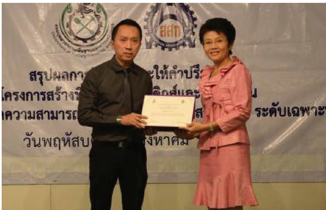
โครงการสร้างที่ปรึกษาด้านการจัดการ โลจิสติกส์และโซ่อุปทานเพื่อเพิ่มขีดความสามารถการแข่งขันภาคอุตสาหกรรม ปี 2558