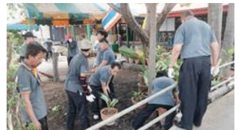
การร่วมพัฒนาชุมชนหรือสังคม