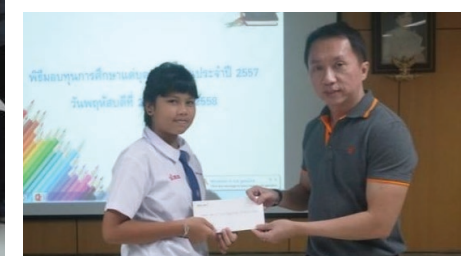
มอบทุนการศึกษาให้กับบุตรพนักงานที่มีผลการเรียนดีตั้งแต่ระดับประถมจนถึงระดับอุดมศึกษา