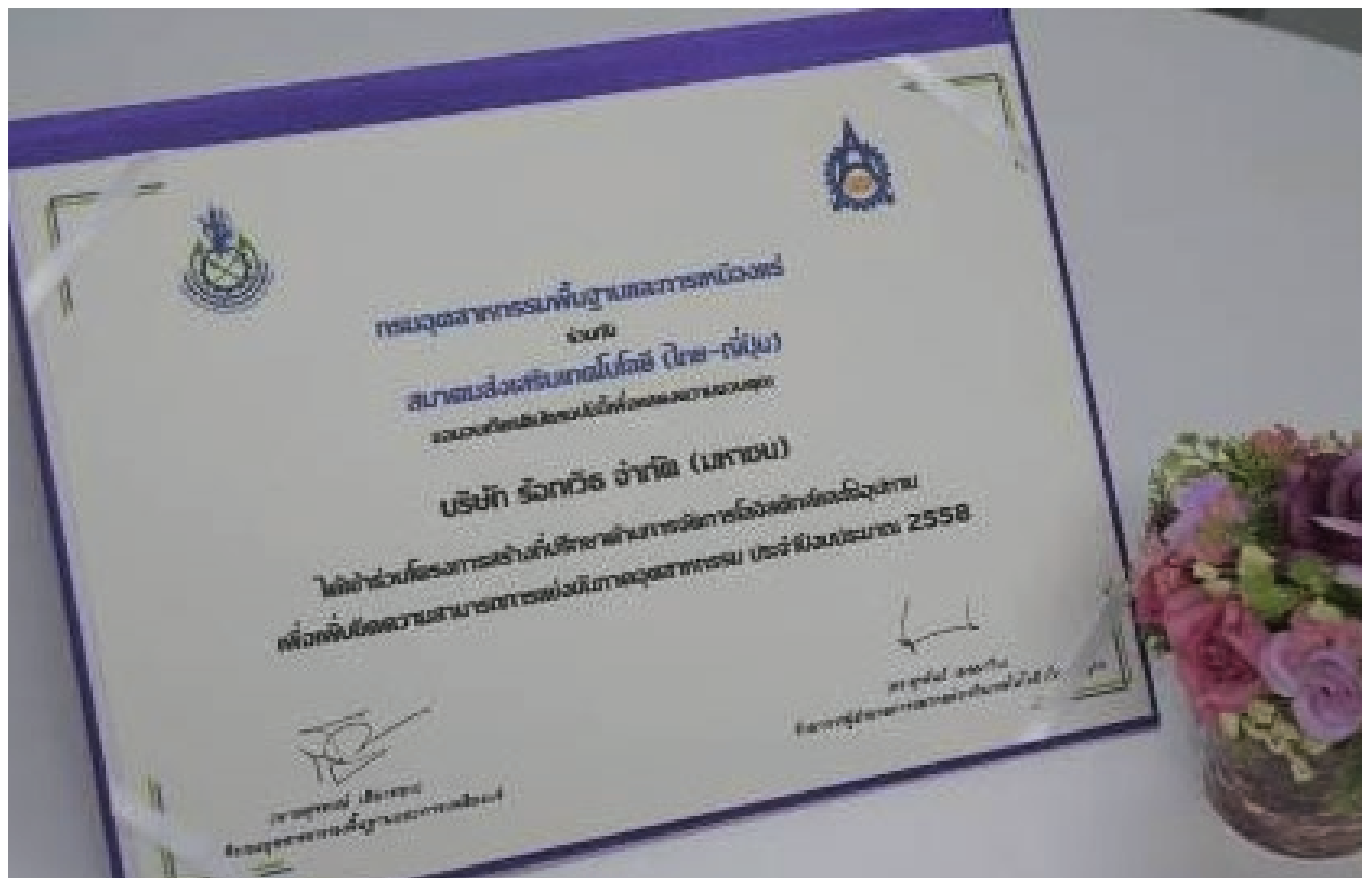
โครงการสร้างที่ปรึกษาด้านการจัดการ โลจิสติกส์และโซ่อุปทานเพื่อเพิ่มขีดความสามารถการแข่งขันภาคอุตสาหกรรม ปี 2558