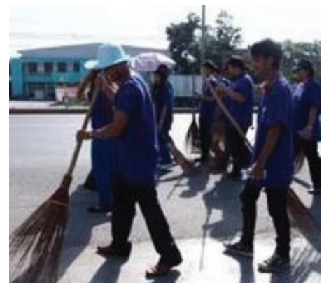
บริษัทได้ร่วมโครงการ รักท้องถิ่น ร่วมใจอนุรักษ์สิ่งแวดล้อม