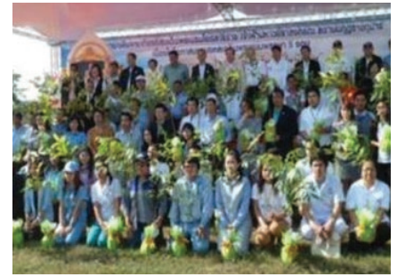
ปลูกต้นไม้เพิ่มพื้นที่สีเขียว ในพื้นที่การนิคมอุตสาหกรรมบางปะอิน

ร็อกเวียให้ความสำคัญในฐานะเจ้าของบริษัทจึงกำหนดให้คณะกรรมการในฐานะตัวแทนของผู้ถือหุ้น รวมทั้งผู้บริหารพนักงาน มีหน้าที่ดำเนินธุรกิจตามหลักการค่านิยมขององค์กร เพื่อให้เกิดประโยชน์สูงสุด และเพิ่มมูลค่าให้กับผู้ถือหุ้นในระยะยาว ส่งเสริมความสัมพันธ์อันดีกับผู้ถือหุ้นจึงจัดกิจกรรมที่เป็นประโยชน์ต่อสังคมและสิ่งแวดล้อม ได้จัดกิจกรรมให้ผู้ถือหุ้นได้มีส่วนร่วมกับการอนุรักษ์สภาพแวดล้อม และส่งเสริมการอยู่ร่วมกับสังคม ชุมชนอย่างยั่งยืน