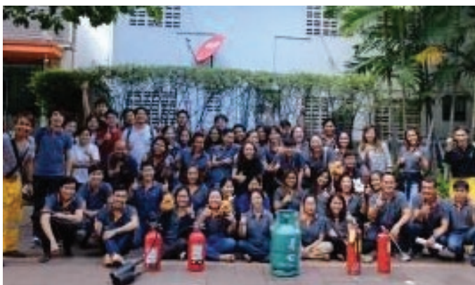
ด้านอาชีวอนามัยและความปลอดภัย