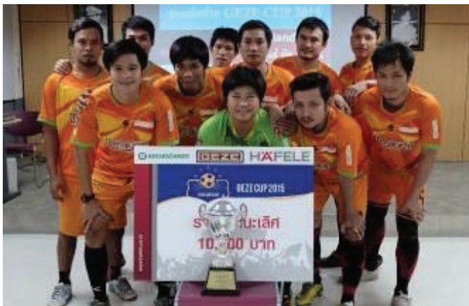
ด้านสวัสดิการ