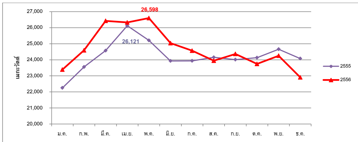
กราฟแสดงความต้องการใช้ไฟฟ้าสูงสุด ปี 2555-2556

แหล่งที่มา: การไฟฟ้าฝ่ายผลิตแห่งประเทศไทย