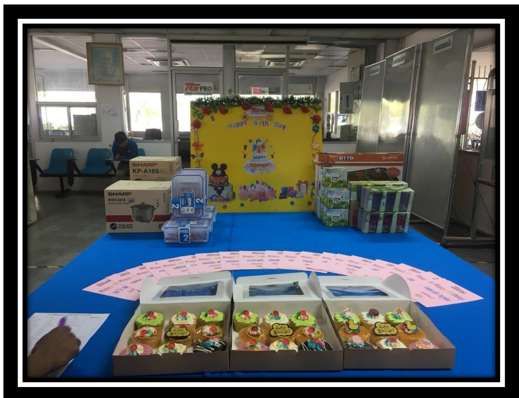
กิจกรรมวันเกิดพนักงาน