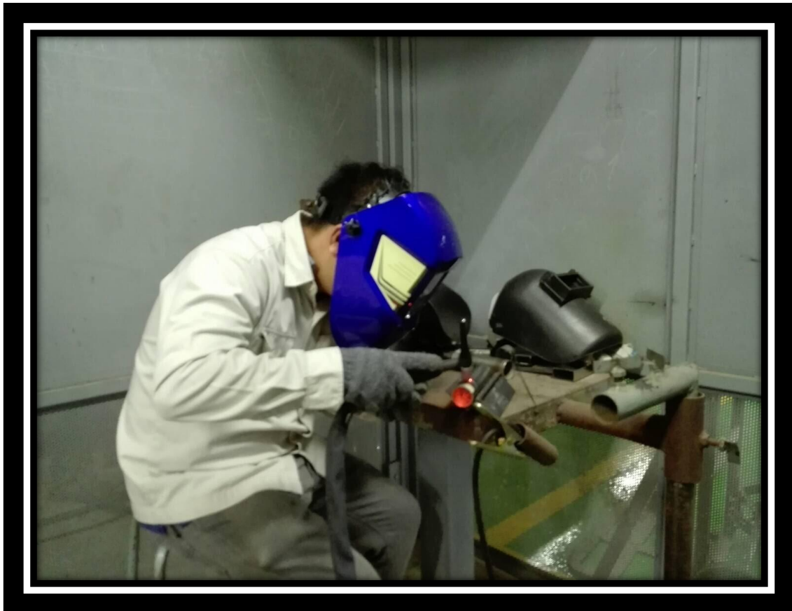
อบรมการเชื่อมสเตนเลสที่สถาบันพัฒนาฝีมือแรงงานสมุทรปราการ

จากโครงการดังกล่าวให้ประโยชน์ในด้านการพัฒนาอย่างยั่งยืนในทั้งมิติของสังคม โดยการสร้างโอกาสในการมีอาชีพของคนในสังคม, ในด้านเศรษฐกิจโดยการสร้างโอกาสที่จะเป็นลูกค้าของบริษัทในอนาคต และในด้านของสิ่งแวดล้อมโดยการใช้สเตนเลสเกรดสูงซึ่งเป็นโลหะที่สามารถนำมารีไซเคิลได้เกือบ 100%