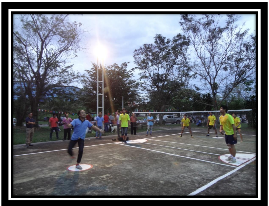
กีฬากระชับความสัมพันธ์ระหว่างพนักงาน