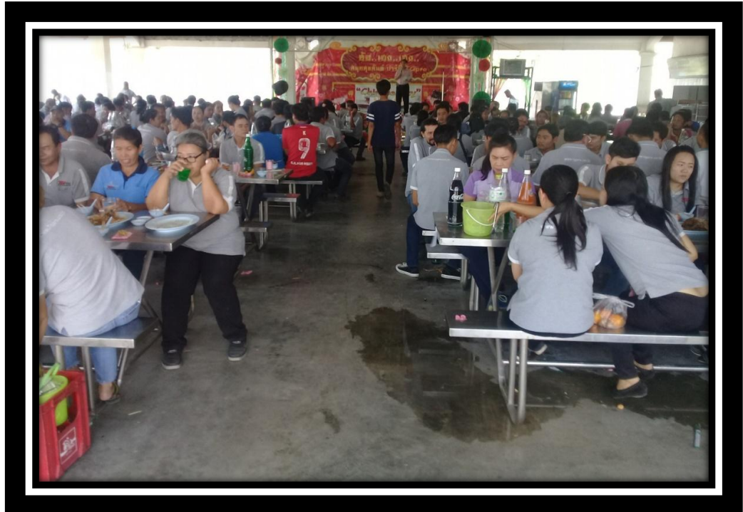
กิจกรรมสังสรรค์ปีใหม่

บริษัทฯ ได้ปรับปรุงโครงสร้างเงินเดือนอย่างเป็นธรรมและสอดคล้องกับสภาพการแข่งขันของตลาดแรงงาน และมีจัดสวัสดิการให้แก่พนักงานดีกว่าที่กฎหมายได้กำหนดบังคับไว้ มีการจัดกิจกรรมกระชับความสัมพันธ์พนักงาน