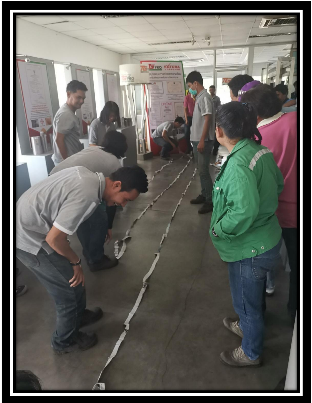
ฝึกอบรมความรู้ / เพิ่มทักษะพนักงาน

นอกจากนี้บริษัทยังจัดกิจกรรมต่างๆ เพื่อสร้างความสัมพันธ์อันดีระหว่างพนักงานด้วยกัน เช่น กิจกรรมการแข่งขันกีฬาระหว่างพนักงานโรงงานและพนักงานสำนักงาน, กิจกรรมการออกกำลังกายหลังเลิกงาน ซึ่งการออกกำลังกายเป็นการเพิ่มความสมบูรณ์แข็งแรงของร่างกายและมียังผลดีกับสมองและการควบคุมอารมณ์อีกด้วย