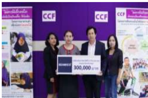
สมทบทุนเพื่อการดำเนินงานของมูลนิธิซี.ซี.เอฟ.