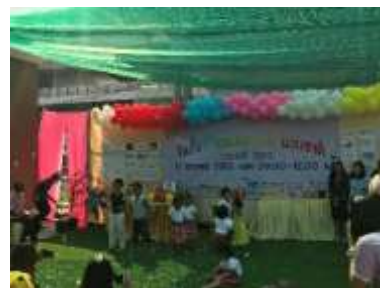
กิจกรรมวันขึ้นปีใหม่และวันเด็กแห่งชาติ ศูนย์การศึกษาพิเศษ ประจำจังหวัดนนทบุรี 11 ม.ค. 2562