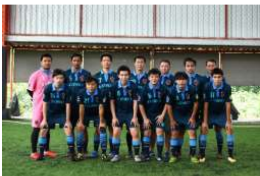
Singha Broker Cup 2019

บริษัทสนับสนุนให้บุคลากรเล่นกีฬา ส่งเสริมนักกีฬาที่มีความสามารถให้เป็นตัวแทนบริษัทไปร่วมแข่งขันกีฬาระหว่างกลุ่มธุรกิจหลักทรัพย์ การแข่งขันกีฬาที่จัดเป็นประจำทุกปี ได้แก่ การแข่งขันฟุตบอล Singha Broker Cup และการแข่งขันแบดมินตัน Broker Badminton Championship ซึ่งการแข่งขันกีฬาต่างๆ ดังกล่าว เป็นการจัดขึ้นเพื่อกระชับความสัมพันธ์ระหว่างหน่วยงานในกลุ่มธุรกิจหลักทรัพย์และหน่วยงานที่เกี่ยวข้องโดยใช้กีฬาเป็นสื่อกลาง ได้แก่ บริษัทสมาชิกในกลุ่มบริษัทหลักทรัพย์ สมาคมบริษัทหลักทรัพย์ไทย ตลาดหลักทรัพย์แห่งประเทศไทย และชมรมนักข่าว เป็นต้น การแข่งขันกีฬาถือเป็นกิจกรรมที่ส่งเสริมสุขภาพ และสร้างความสามัคคีระหว่างพนักงาน รวมถึงความสัมพันธ์ที่ดีระหว่างหน่วยงานด้วย