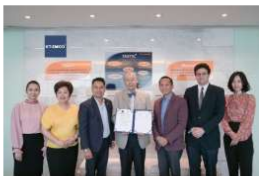
พิธีลงนามบันทึกความเข้าใจว่าด้วยความร่วมมือโครงการฯ กับสมาคมพัฒนาประชากรและชุมชน วันที่ 22 ก.ค. 2562