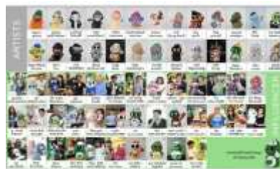
นิทรรศการ ณ ห้องออคิดทอเรียม หอศิลป์วัฒนธรรม