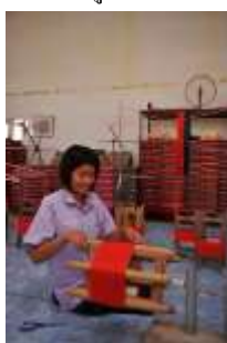
การส่งเสริมอาชีพตามหลักเศรษฐกิจพอเพียง