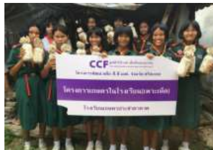
โครงการเกษตรในโรงเรียน