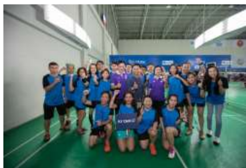
Broker Badminton Championship 2019