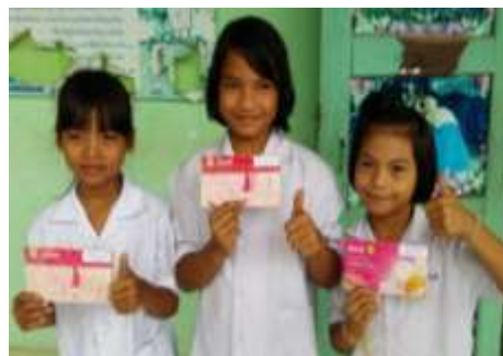
การมอบทุนการศึกษา