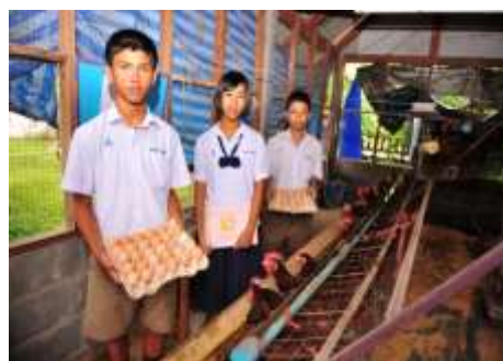
การส่งเสริมด้านอาชีพให้กับนักเรียนมัธยมศึกษาตอนต้น