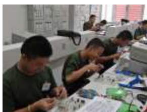
การให้ความรู้ด้านอิเล็กทรอนิกส์