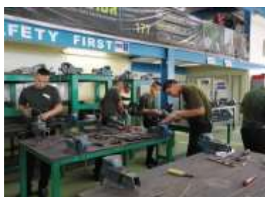
การฝึกอบรมเครื่องมือช่างขั้นพื้นฐาน

ซึ่งในปีที่ผ่านมา บริษัทฯ ได้สมทบทุนเข้ากองทุนดังกล่าวสำหรับโรงเรียนพระดาบส กรุงเทพมหานคร และโรงเรียนพระดาบส จังหวัดชายแดนภาคใต้ เพื่อช่วยเหลือผู้ด้อยโอกาสทางการศึกษาให้มีโอกาสศึกษาเล่าเรียนด้านวิชาชีพจนจบหลักสูตร สามารถเป็นที่พึ่งของตนเอง ครอบครัว ชุมชนและประเทศชาติได้ต่อไป