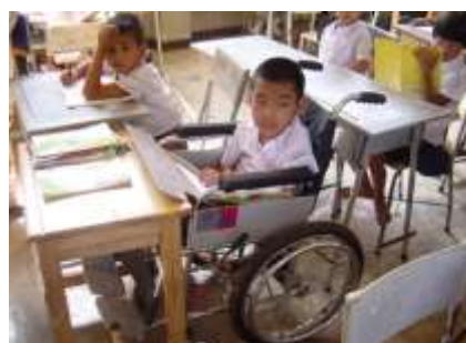
ทุนการศึกษาเพื่อนักเรียนพิการเรียนร่วมในโรงเรียนปกติ