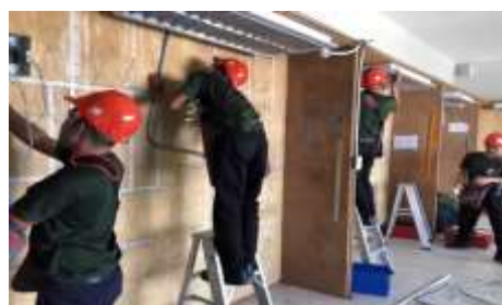
การฝึกอบรมงานช่างไฟฟ้า