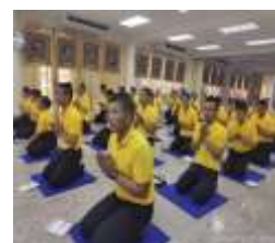
กิจกรรมฝึกจริยธรรมแก่ผู้เรียน