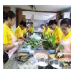
การอบรมด้านเคหะบริบาล