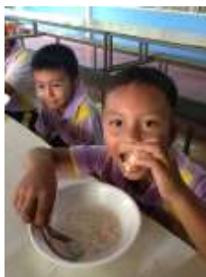
โครงการอาหารเช้าเพื่อน้อง