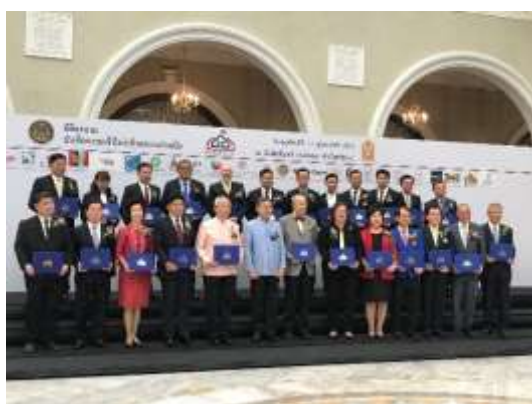
พิธีลงนามบันทึกความเข้าใจว่าด้วยความร่วมมือโครงการฯ กับสำนักงานคณะกรรมการการศึกษาขั้นพื้นฐาน กระทรวงศึกษาธิการวันที่ 14 ก.พ. 2562

บริษัทหลักทรัพย์ กรุงไทย ซีมิโก้ จำกัด ได้ลงนามความร่วมมือกับสำนักงานคณะกรรมการ การศึกษาขั้นพื้นฐาน กระทรวงศึกษาธิการ และสมาคมพัฒนาประชากรและชุมชน ในการ ดำเนินโครงการโรงเรียนร่วมพัฒนา (Partnership School Project) เพื่อให้โรงเรียนเป็น ศูนย์กลางในการพัฒนาคุณภาพชีวิตและรายได้ในชุมชนรอบโรงเรียน โดยบริษัทฯ ได้ร่วม ศึกษาข้อมูลและคัดเลือกโรงเรียนรวมมิตรวิทยา อำเภอลำปลายมาศ จังหวัดบุรีรัมย์ เป็น โรงเรียนที่จะพัฒนาตามแนวทางของโครงการดังกล่าว เป็นระยะเวลา 3 ปี เริ่มตั้งแต่ปี พ.ศ. 2562 เป็นต้นไป โดยกิจกรรมการพัฒนายจะแบ่งเป็น 8 ด้าน ได้แก่ การพัฒนาคุณภาพ การศึกษาและวิชาการ การพัฒนาอาชีพและรายได้ การจัดตั้งกองทุนเงินฝากและเงินกู้สำหรับ นักเรียนและสมาชิกในชุมชน การพัฒนาสุขภาพอนามัย การพัฒนาสิ่งแวดล้อม การสร้าง ความเข้มแข็งเพื่อให้ชุมชนมีบทบาทและมีส่วนร่วมในโรงเรียน การสร้างความเข้มแข็ง เพื่อให้โรงเรียนและนักเรียนมีบทบาทในการร่วมพัฒนาชุมชน และการต่อต้านคอร์รัปชัน และเพิ่มบทบาทของนักเรียนเพื่อส่งเสริมระบอบประชาธิปไตย