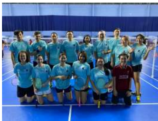
Broker Badminton Championship 2020

บริษัทฯ สนับสนุนให้บุคลากรเล่นกีฬา ส่งเสริมนักกีฬาที่มีความสามารถให้เป็นตัวแทนบริษัทฯ ไปร่วมแข่งขันกีฬาระหว่างกลุ่มธุรกิจหลักทรัพย์ ในปี 2563 มีการจัดการแข่งขันแบดมินตัน Broker Badminton Championship ซึ่งจัดขึ้นเพื่อกระชับความสัมพันธ์ระหว่างหน่วยงานในกลุ่มธุรกิจหลักทรัพย์และหน่วยงานที่เกี่ยวข้องโดยใช้กีฬาเป็นสื่อกลาง ได้แก่ บริษัทสมาชิกในกลุ่มบริษัทหลักทรัพย์ สมาคมบริษัทหลักทรัพย์ไทย ตลาดหลักทรัพย์แห่งประเทศไทย และชมรมนักข่าว เป็นต้น การแข่งขันกีฬาถือเป็นกิจกรรมที่ส่งเสริมสุขภาพ และสร้างความสามัคคีระหว่างพนักงาน รวมถึงความสัมพันธ์ที่ดีระหว่างหน่วยงานด้วย