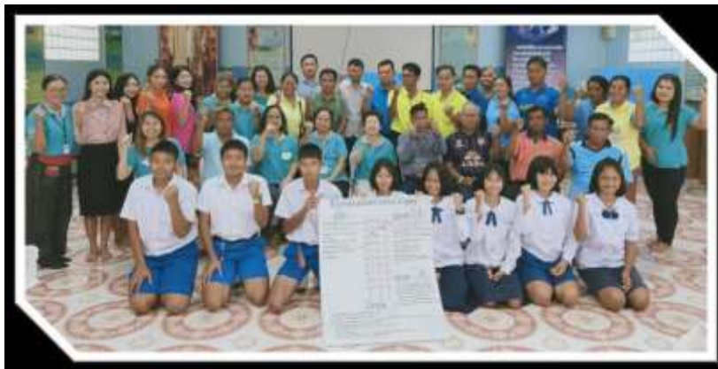
โรงเรียนรวมมิตรวิทยา จังหวัดบุรีรัมย์