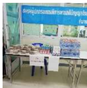
กิจกรรมวันขึ้นปีใหม่และวันเด็กแห่งชาติ ศูนย์การศึกษาพิเศษ ประจำจังหวัดนนทบุรี 10 ม.ค. 2563