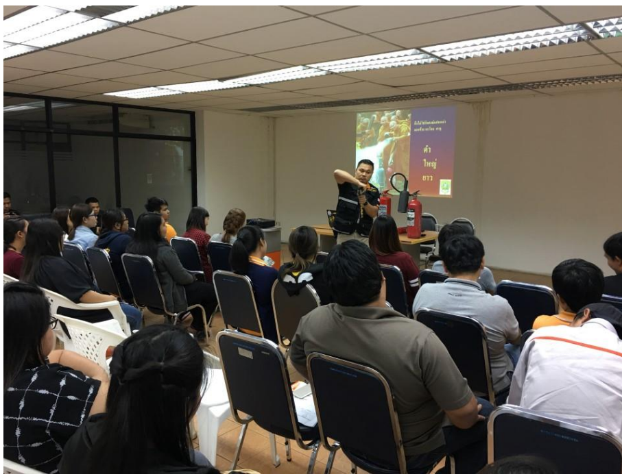
ภาพการฝึกซ้อมดับเพลิงและการฝึกซ้อมหนีไฟ เมื่อวันที่ 24 พฤศจิกายน พ.ศ. 2560