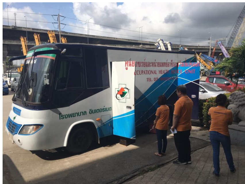
ภาพการตรวจสุขภาพพนักงาน เมื่อวันที่ 8 กันยายน 2560