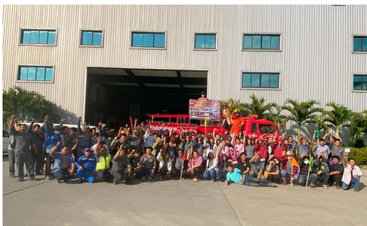
หลักสูตรการฝึกอบรมผู้บังคับปั้นจั่น ชนิดปั้นจั่นหอสูง รถ เรือปั้นจั่น ผู้ให้สัญญาณแก่ผู้บังคับปั้นจั่น ผู้ยึดเกาะวัสดุผู้ควบคุม ระหว่างวันที่ 26-27 เม.ย.62 , 26-27 ก.ค.62 และ 25 ต.ค.62