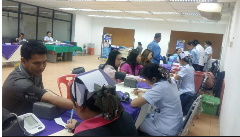
ภาพการตรวจสอบสภาพพนักงาน เมื่อวันที่ 12 พฤศจิกายน 2562